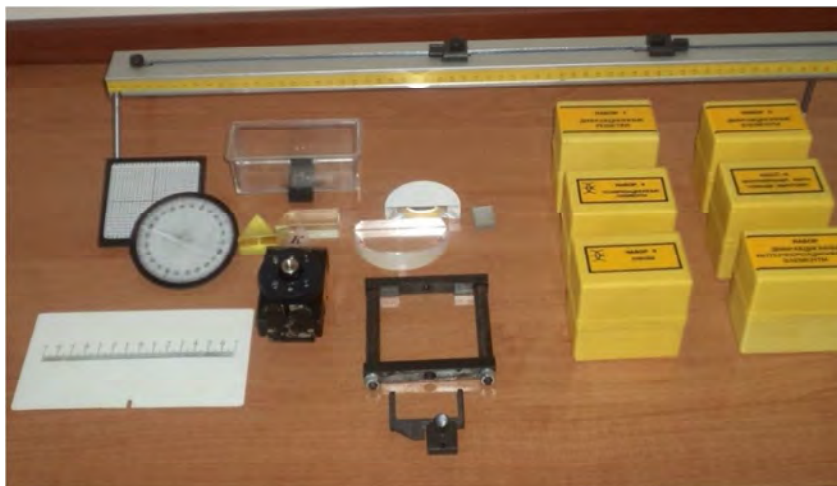
Рисунок 2 – Загальний вигляд комплекту приладів «Оптична міні-лава»

Комплект «Оптична міні-лава» призначений для проведення демонстраційних дослідів та самостійних досліджень учнів (студентів) з геометричної та хвильової оптики (рис. 2).