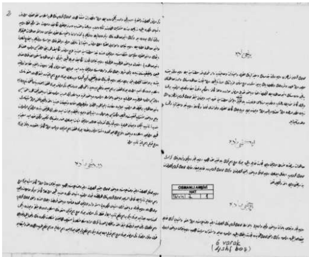
Рис. 1. Турецко-русский торговый договор 1846 г.

Как это было закреплено в договорах, заключённых с другими иностранными государствами, таможенная пошлина для внешней торговли была установлена в размере 3 %. Было принято, что налог с товаров, произведенных в России или же в других государствах и ввозимых в Османскую империю, или же товаров, вывозимых из Османского государства российскими купцами и подданными, взимается на прежних условиях 8 .