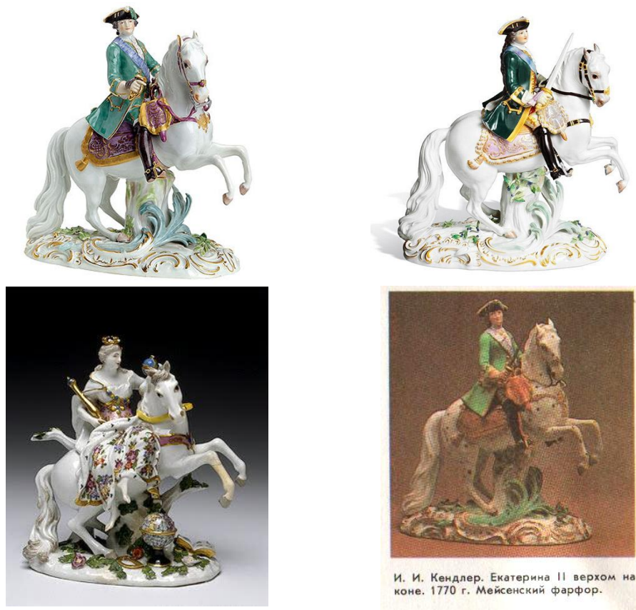
Рис. 10. Екатерина II верхом на коне. Йохан Йоахим Кендлер. 1770 г.