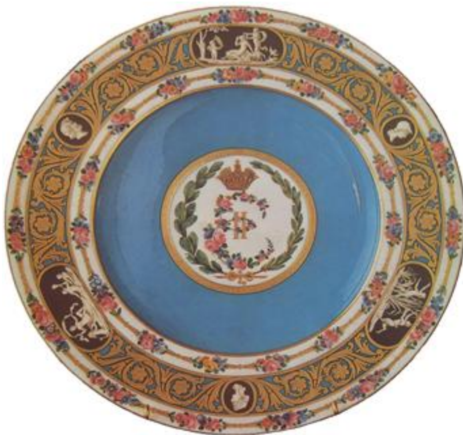
Рис. 7. Севрское блюдо

Севрское блюдо (в то время в России тарель), созданное для Екатерины II. Севрский Музей керамики, II-я половина XVIII в. Как и в рококо, узор отличается нарочитой роскошью, хотя орнаментные мотивы иные. На этом блюде, созданном специально для Екатерины II, русской императрицы (1762–1796), орнамент из листьев и камей, выдержанных в классическом стиле, заменяет раковины, характерные для стиля рококо 11