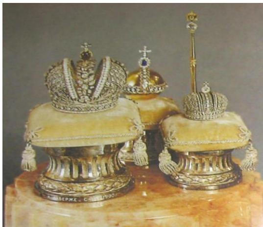
Рис. 2. Миниатюрные копии императорских регалий 1889–1900 гг. Петербург. Фирма Фаберже. Мастера: Ю. А. Рапопорт, Т. А. Хольмстрем