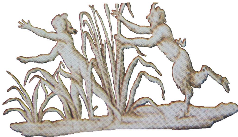
Рис. 6. Иллюстративный фрагмент Сервского блюда

В дополнениях представлены две иллюстрации (рис. 8, 9) из книги академика А. Е. Ферсмана 8 . Мы попытались теоретически и на практических лабораторных занятиях показать распознавание обратимых склеек, проклеек, приклеек с использованием припороха минеральных пудр разных фракций, а главное продемонстрировать искусство уральских камнерезов середины XIX ст., берущее своё начало из глубокой древности. Авторы статьи предполагают, что на блюде изображены в античных сценах первые фуршетные фигурки Фальконе и Мари Анн Коло для фуршетных застолий при дворе Екатерины II и Потёмкина, что не исключает изображения шаржа в образе Пана, “рогатого” Людовика XV и Г. А. Потёмкина, как считает целый ряд исследователей, которые встречали на закрытых антикварных рынках фуршетные фигурки, где с одной стороны лицо Людовика, а с другой – Потёмкина. Но кому это было нужно? Может быть монархическим масонам?