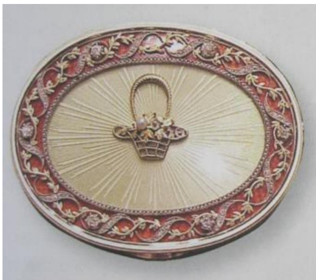
Рис. 1. Табакерка с изображёнными растительными орнаментами представлена аннотацией в журнале: букет цветов на верхней крышке. Золото, 6 бриллиантов, бриллианты огранки “роза”, жемчужины, эмаль двух цветов по гильйошированному полю.

Изучая иллюстрации к вышеуказанному мультфильму, мы пришли к выводу, что его художники-оформители, в свою очередь, являлись поисковиками фуршетных фигурок. В самом мультфильме изображены “объёмно-плоскостные”, “мишенеподобные” фигурки, то есть в форме дворцовых мундиров, “тирных мишеней” – слуги, отдельные персонажи мультфильма. Главное же состоит в том, что пара фуршетных фигурок, предположительно по стилю мейсонского фабричного фарфора, покрытых “люрексной” глазурью и выставленных в мультфильме по самому заднему краю на будуарной столешнице в стиле Буль, словно выполнена из тонкой фольги как мишени, но раскрашены объёмно. Допускаем, что исполнители могли подразумевать и первоначальное изготовление их из бумаги или картона.