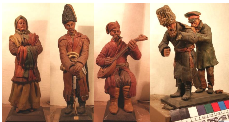
Рис. 11. Фигурки из хлебного мякиша коллекции Д. И. Яворницкого