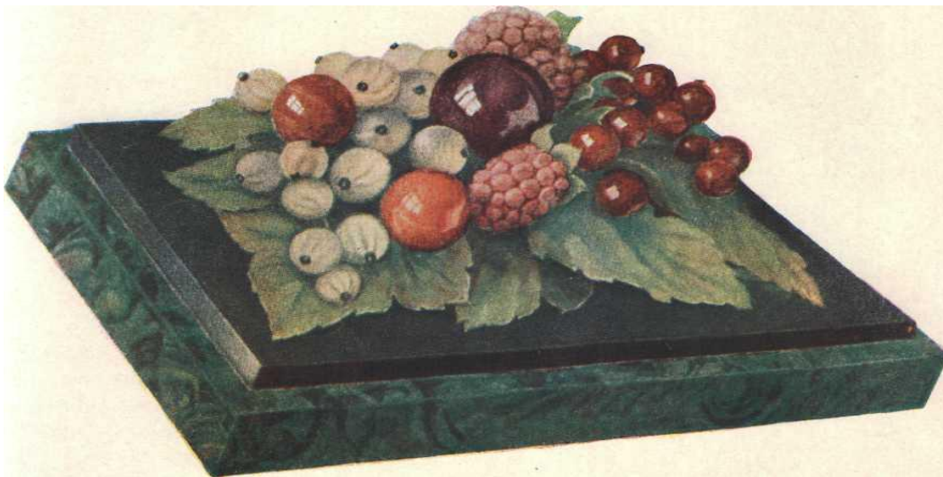
Рис. 9. Работа уральских кустика-гранильщиков. Объёмная мозаика из различных цветных камней. Пресс