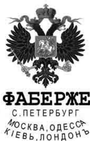
Рис. 4. Клеймо двуглавый орел. Фаберже