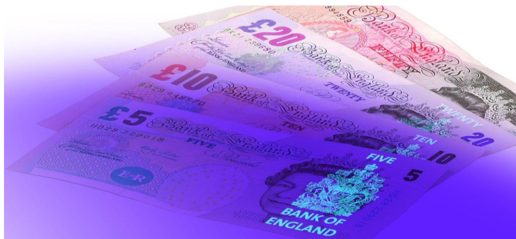
Рис. 8. Британские фунты в ультрафиолетовом излучении