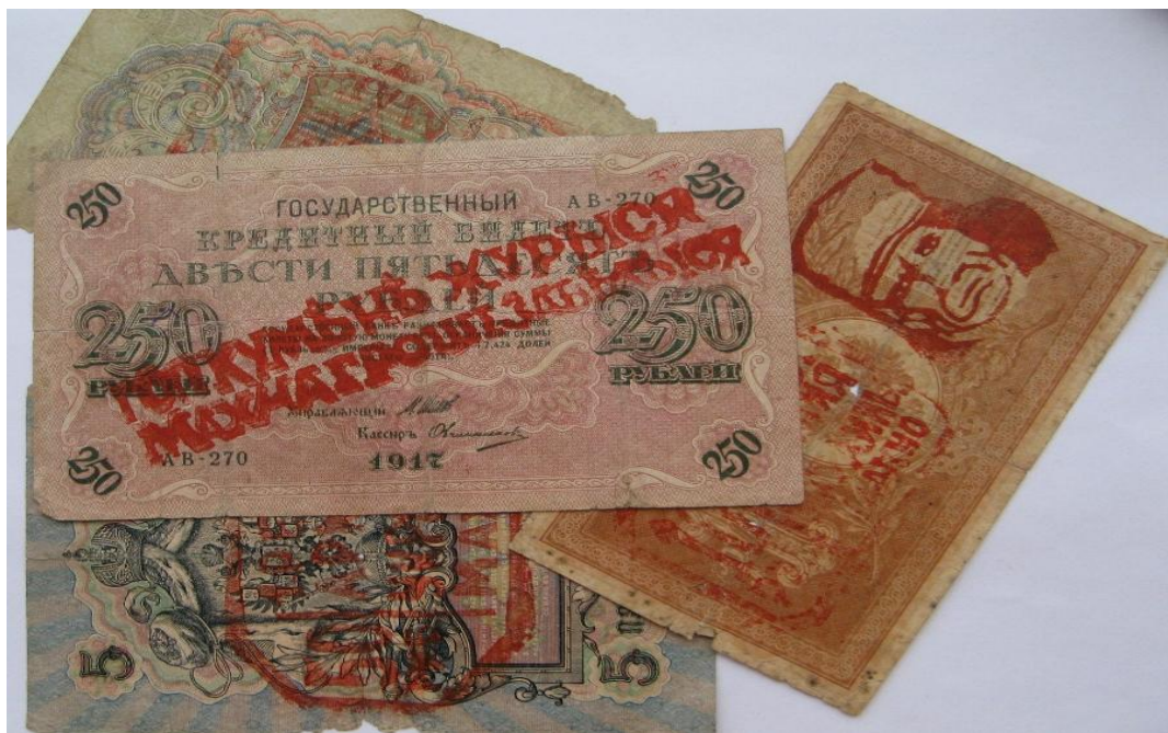
Рис. 4. Банковские надпечатки на банкноты Российской империи

34 Банковские надпечатки – дополнительно напечатанные текст и (или) графическое изображение на банкноте, ценной бумаге или ином знаке оплаты после того, как они были напечатаны. Ярким примером этого служат представленные ниже образцы “махновской валюты” периода гражданской войны 1918–1922 гг. Как видно, на банкноты Российской империи и “керенки” кустарным способом наносили своеобразные “дополнения” (рис. 4).