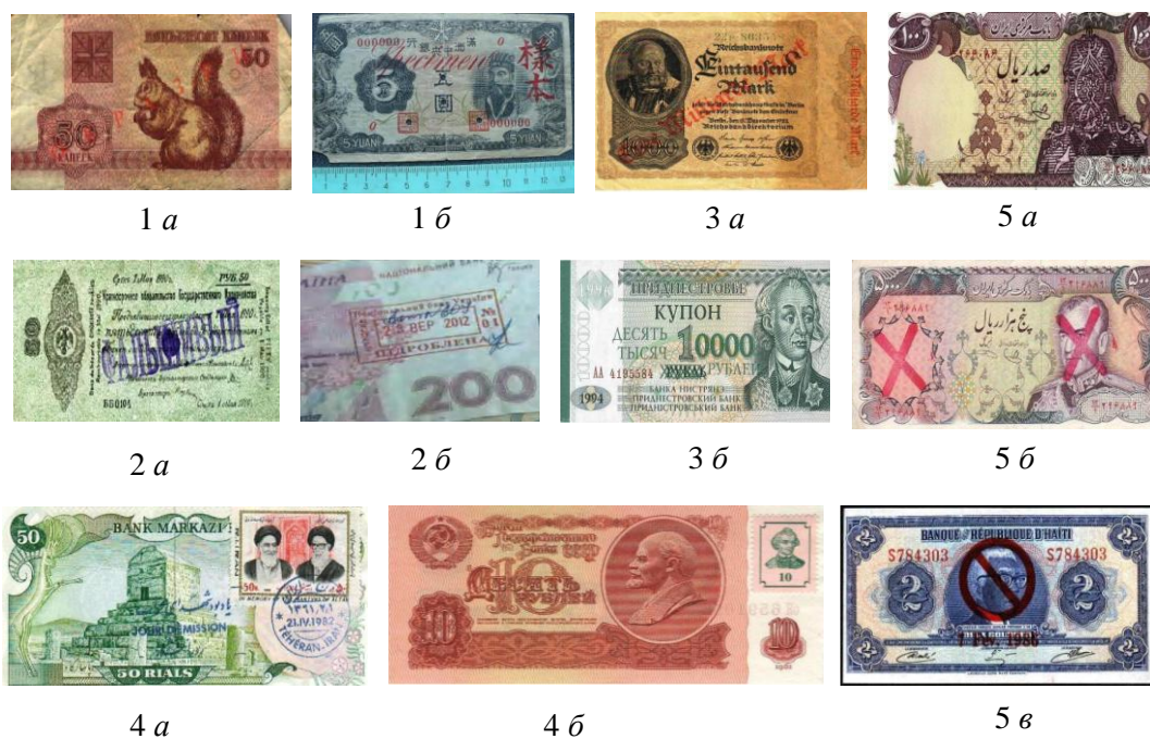
Рис. 6. Пять групп банковских надпечаток

4) при провозглашении отдельными регионами страны своей независимости (или после революции, изменившей государственный строй) (до введения своей валюты) используют находящуюся у них денежную массу некогда единого государства, “украшенную” печатями нового казначейства или дополненную гербовыми (почтовыми) марками, как это было в Иране (рис. 6.4 а 42 ) и Приднестровье (рис. 6.4 б 43 );