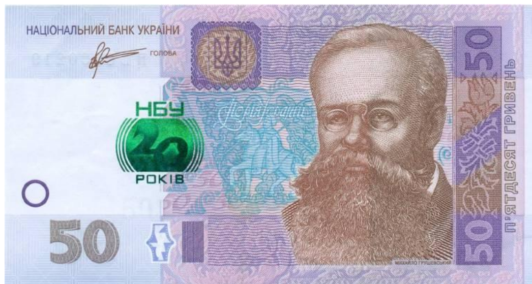
Рис. 5. Банкнота в 50 грн, випущена в честь 20-ліття НБУ

Существующие банковские надпечатки условно можно разделить на пять групп экономического или политического характера, представленных на расположенной ниже иллюстрации: