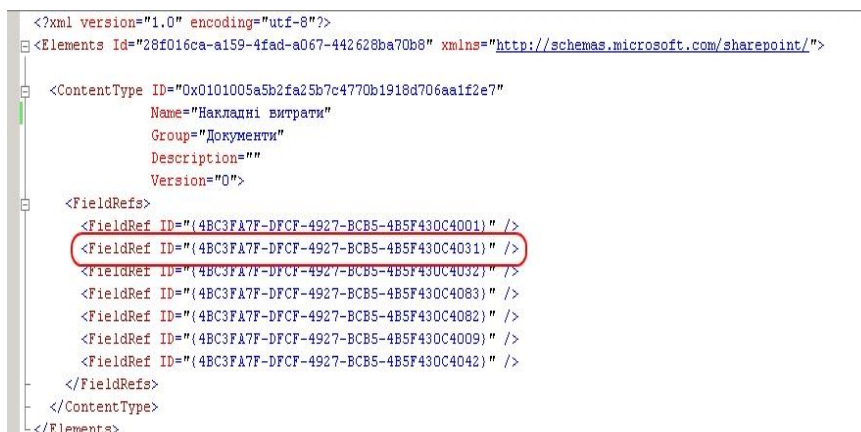
Рис. 2. Опис показників на мові XML (фізична модель)

На рис. 2 представлено опис документу «Накладні витрати» на мові XML (фізична модель даних), де обведено ідентифікатор показника «Номер договору».