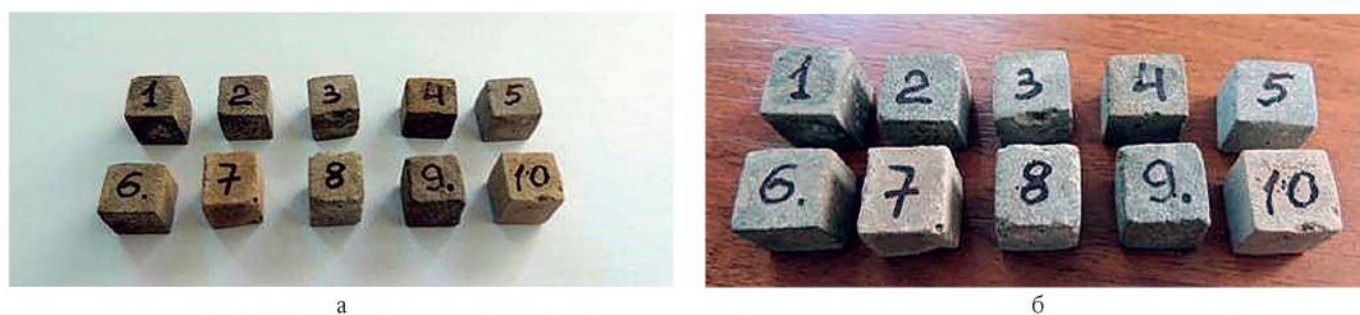
Рис. 2. Вигляд зразків: а – до опромінення; б – після \gamma -опромінення дозою 10 кГр