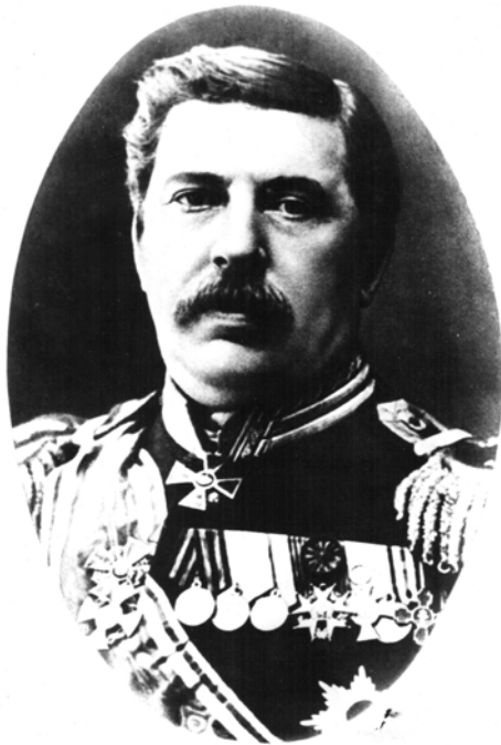
Рис. 1. Д. І. Виводцев.

губернії; закінчив Одеську гімназію; медичну освіту здобув на медичному факультеті Університету св. Володимира (Київ, 1857); у 1860-х рр. удосконалювався за кордоном (Відень, 1865); у 1865 р. захистив докторську дисертацію “О лимфатических сосудах легких”; як військовий хірург брав участь у франко-прусській (1870-1871) та російсько-турецькій війнах (1877-1878); у мирний час працював на посадах лікаря та викладача хірургії у Хрестовоздвиженській общині сестер милосердя, консультанта з хірургії у Максиміліанівській лікарні (С.-Петербург), понадштатного лікаря імператорських театрів, гоф-медика 1-го придворного округу, та в Маріїнському притулку для ампутованих і покалічених воїнів; дійсний таємний радник; з 1890 р. у відставці; член Російського хірургічного товариства імені М. І. Пирогова; дорадчий член Військово-медичного вченого комітету; розробив оригінальні методи бальзамування трупів: апарат (ін'єктор) Виводцева — апарат для ін'єкції в судини консервуючої рідини, рідина Виводцева — спиртово-водний розчин гліцерину і тимолу, метод бальзамування Виводцева, який полягає у введенні рідини Виводцева у судини за допомогою апарата Виводцева; 26.11.1881 р. бальзамував тіло М. І. Пирогова; у 1877 р. за апарат для бальзамування отримав першу премію на виставці у Філадельфії (США).