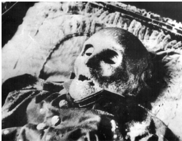
Рис. 2. Тіло М. І. Пирогова до ребальзамації.

полном смысле слова, ужасающий вид. Лицо было сморщено, мумифицировано, кожа бурой окраски с большим количеством желтоватых узелков жировоска поперечником в 0,2-0,4 см. Волосы с головы и бороды выпадали при легком к ним дотрагивании. Нос, ушные раковины, веки высохшие, уплотненные. Глазные впадины глубокие. Губы высохшие, подвернутые в значительно открытый рот. Кожа на кистях рук пестрой, желтоватой с белыми пятнами окраски. Пальцы мумифицированы, неподвижны, в согнутом положении. Ногти легко отделялись, на коже запястий имелось значительное число узелков жировоска. На открытых частях тела, одежде и внутреннем убранстве гроба найдено большое количество плесени. Оставляют останки Н. И. Пирогова в таком виде для обозрения было конечно, невозможно” (рис. 2).