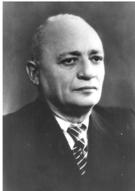
Рис. 3. Р. Д. Синельников.

ройкова на посаді асистента кафедри анатомії; одночасно працював на посадах доцента та завідувача кафедри анатомії 2-го Харківського медичного інституту (1930-1937), старшого наукового співпрацівника та а завідувача (1938-1941) відділу нормальної анатомії Українського інституту експериментальної медицини; від 1937 до 1971 р. — завідувач кафедри 1-го Харківського медичного інституту; від 1929 р. залучався до роботи зі збереження тіла В. І. Леніна, був співпрацівником лабораторії при Мавзолеї В. І. Леніна; у 1938 р. захистив докторську дисертацію “Нервы мочевого пузыря человека”; професор (1938); автор понад 120 наукових публікацій; наукові праці переважно присвячені обґрунтуванню нового напрямку анатомічних досліджень — порівняльна мікро- і макроскопічна анатомія; спільно з В. П. Воробйовим підготував “Атлас анатомии человека”; у 1952-1958 рр. створив новий “Атлас анатомии человека”, спочатку у 2, а потім 3 томах, який витримав ряд видань і був перекладений на кілька іноземних мов.