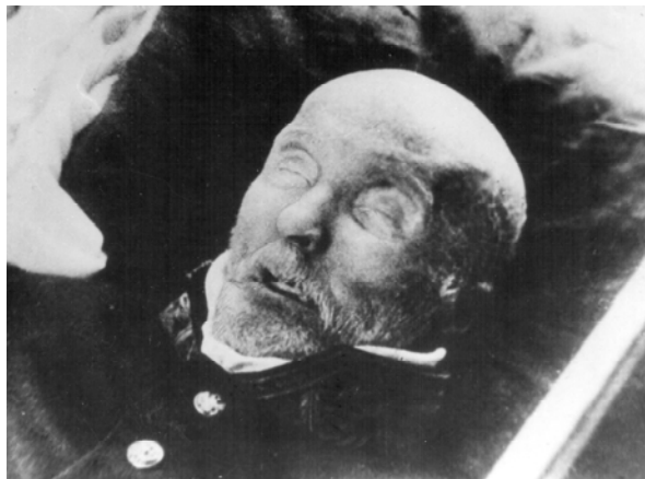
Рис. 4. Тіло М. І. Пирогова після ребальзамації.

формаліну, гліцерину та води. У подальшому виконувалось місцеве оброблення тіла, після чого воно знову занурювалось у ванни з більшою кількістю, ніж на попередніх етапах, гліцерину. Загальна тривалість реставрації продовжувалась майже чотири місяці (рис. 4, 5).