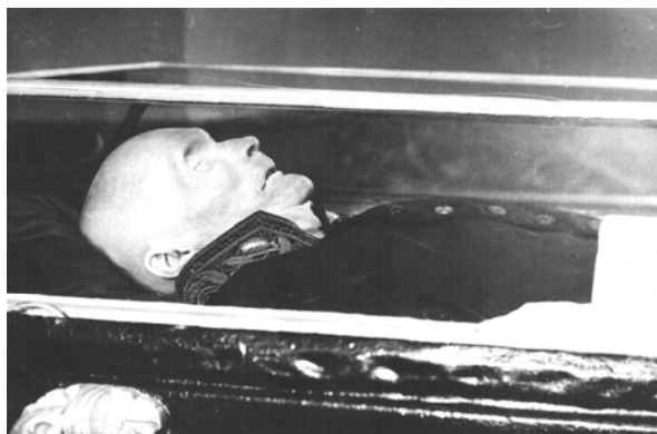
Рис. 5. Тіло М. І. Пирогова у саркофазі після ребальзамації.

Члени Пироговської комісії перших років її роботи згадували, що під час огляду тіла М. І. Пирогова після першої реставрації, у реставрованій труні та новою склянню його частиною, до труни повільно підійшов маленький дідусь, який знав М. І. Пирогова ще при житті. Він уважно оглянув М. І. Пирогова, який був у труні, перехрестився і низько схилив перед труною свою сиву голову. Потім повернувся до членів Пироговської комісії, що стояли групою, і також низько схилив перед ними голову та сказав: “тепер их превосходительство действительно похож на себя” . Це напевно було вищою атестацією роботи Пироговської комісії.