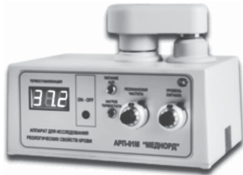
Рис. 1. АРР-01М «Меднорд»

Щойно згусток починає стискатися або руйнуватися (лізис), зв'язки рвуться, взаємодія між чашечкою і стрижнем слабшає, і передача руху чашечки на стрижень