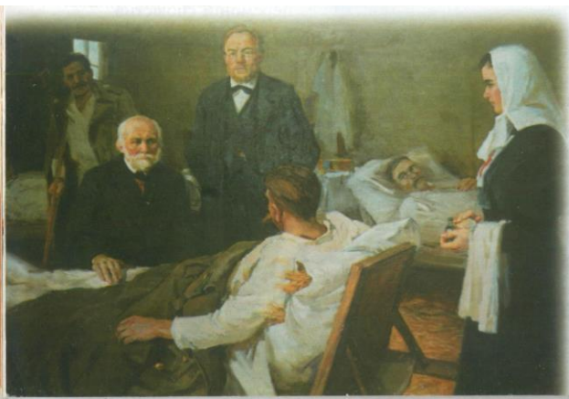
М.І.Пирогов та С.П.Боткін у госпіталі, 1877 р.

Клінічну картину торпідної фази шоку при пораненнях він також описує класично: “З відірваною ногою або рукою лежить окоченілий на перер’язочному пункті нерухомо; він не кричить, не голосить, не жаліється, не бере участі ні в чому і нічого не потребує, тіло холодне, обличчя бліде, як у трупа. Погляд фіксований і повернутий у далечінь, пульс – як нитка, ледве прослідковується під пальцем, з частими перервами. На питання зовсім не відповідає, або ледве шепоче. Дихання поверхневе, непримітне. Рана і шкіра майже зовсім нечутливі. Якщо нерв у рані чим-небудь буде подразнений, то хворий легким скороченням м’язів