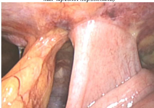
Рис. 2. Рання спайкова кишкова непрохідність (6-а доба після апендектомії)

очевидні: мала травматичність, мініінвазивність, легкий больовий синдром на першу добу після операції, швидке, через 8-16 год, відновлення перистальтики, швидка реабілітація хворих.