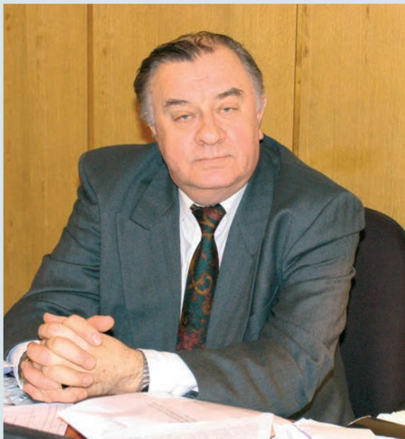
Член-кореспондент НАН і НАМН України, професор В.О. Бобров

лікарів, видання навчально-методичної літератури, проведення науково-практичних конференцій, наукових досліджень, підготовки кадрового резерву. У 2008–2016 рр. на кафедрі працював генеральний директор ДУ «Інститут серця МОЗ України», член-кореспондент НАМН України, професор Б.М. Тодуров, який особисто доклав великих зусиль для створення і розвитку теперішньої клінічної бази кафедри.