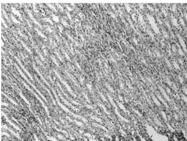
Рис. 3. Фото мікропрепарату нирки щура із створеною внутрішньочеревною гіпертензією тривалістю 24 години. Слабко виражене венозне повнокров'я я мозкової речовини. Гематоксилін і еозин. Об.9 x .Ок.10 x

пінної дистрофії, вираженість якої мінлива по паренхімі печінки (рис. 1).