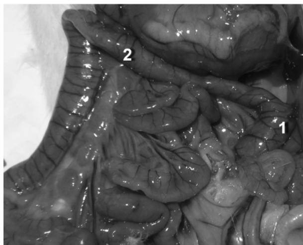
Рис. 3. Моделювання доліхосигми – 60 доба (1 - ректосигмоїдна ділянка, 2 - доліхосигма)

відділі СОК та зменшення навантаження на ректосигмоїдний кут, що досягається консервативним лікуванням.