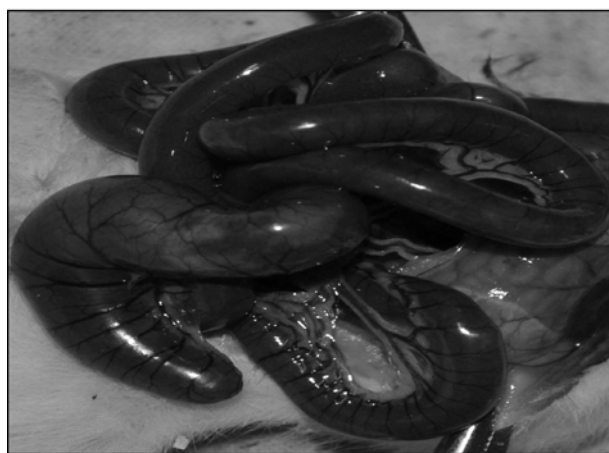
Рис. 2. Оцінка функціонального стану ободової кишки при моделюванні доліхосигми за допомогою розчину барвника