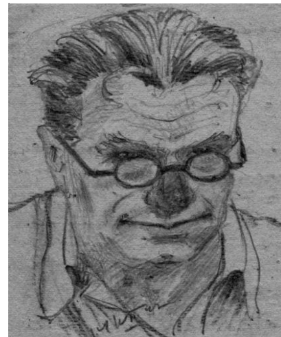
Крайня північ. м.Каргополь. Автопортрет. Олівець. 1944 р.