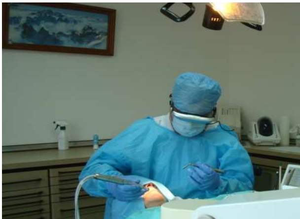
Фото 8. Альпінізм - як філософія лікарської практики

Визначено, що альпінізм - є спосіб формування світогляду фахівців медичного спрямування, шляхом визначення біологічного потенціалу людини при застосуванні всіх можливих видів переміщення в горах. Що дає змогу докорінно змінити ставлення до об'єкта спортивної активності, перетворивши його на суб'єкт дослідження (рис.6,7,8).