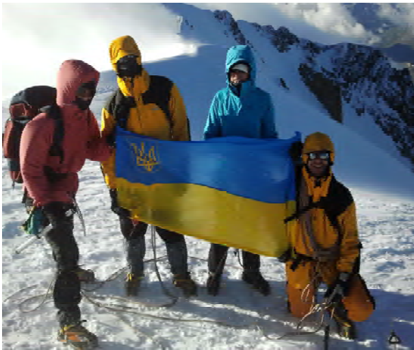
Фото.2. Альпи. в. Мон-блан: символ Української Нації демонструє бельгійсько- українська група

йшли новими технічно важкими шляхами, по одинці, в мусонний період і т. д.) [3,4]. Поділ і спеціалізація - явища закономірні і необхідні для розвитку в будь-якому процесі чи явищі. Так фізика, виділившись з природознавства, поступово ділилася на механіку, термодинаміку, і т. д. Механіка - на статику, кінематику, динаміку: в сукупності вони складають фізику. На нашу думку, альпінізм як вид людської діяльності та філософія пізнання себе і навколишнього середовища підкоряється тим же законам розвитку і може еволюціонувати лише при розвитку всіх напрямків.