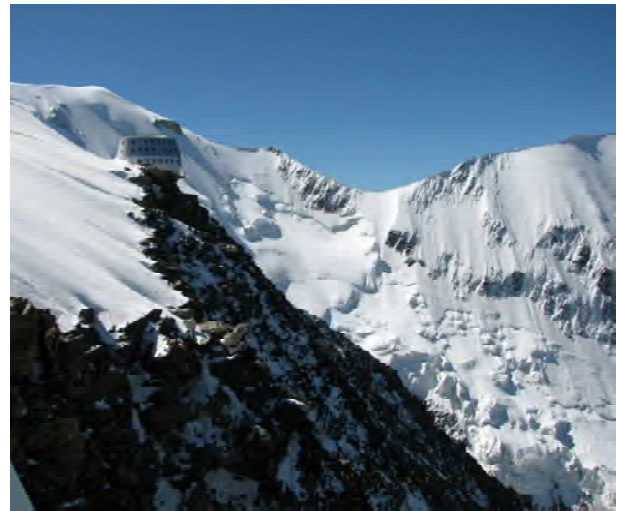
Фото.3. Альпи, високогірна зона Франція - Італія: Інфраструктура для занять альпінізмом

Найефективнішою стратегією навчання: це шанс бути свідком відкриття (фізик-наук. П. Пшенічка, 2014, пара альпін. вид спорт.).