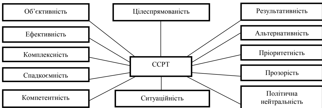
Рис. 2. Модель базових принципів ССРТ

ССРТ базується на принципах, які для наочності сприйняття наведені графічно на рис. 2. Вони характеризуються тим, що орієнтовані на потреби та інтереси людей; спрямовані на чіткі бюджетні пріоритети, на активну і результативну участь усього зацікавленого громадянського суспільства і спираються на тісний зв'язок між національним та місцевим рівнями.