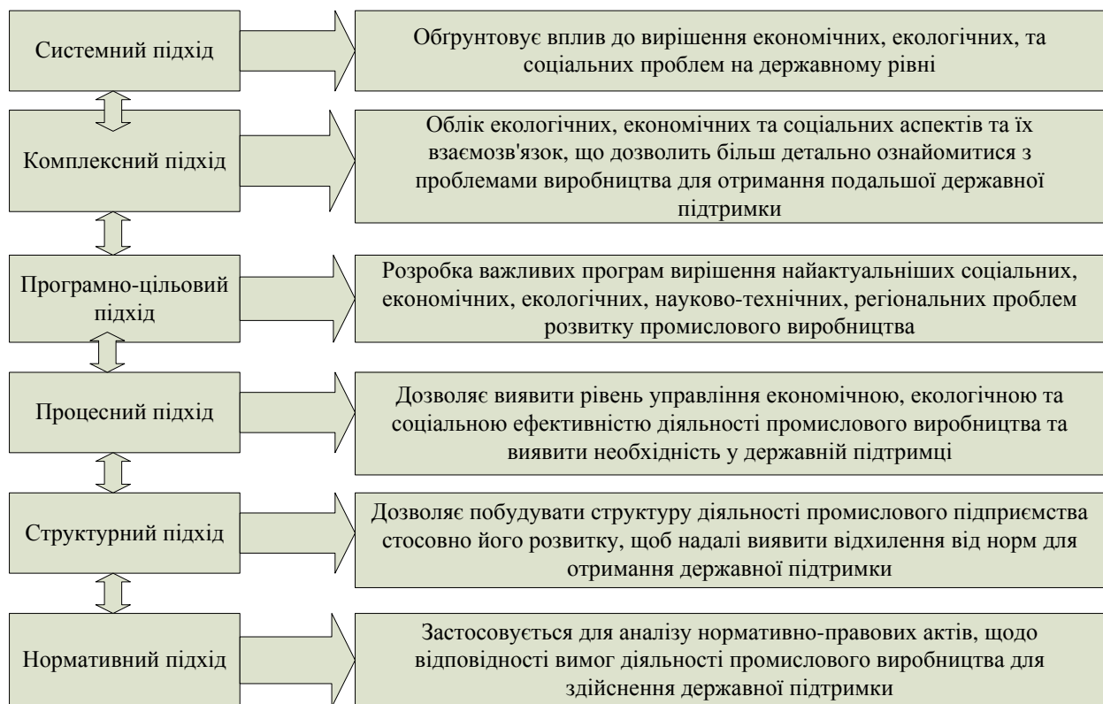
Рис. 2. Підходи до формування державної підтримки сталого розвитку промислового виробництва

Всі підходи узагальнені (рис. 2.) стосовно формування державної підтримки сталого розвитку промислового виробництва.