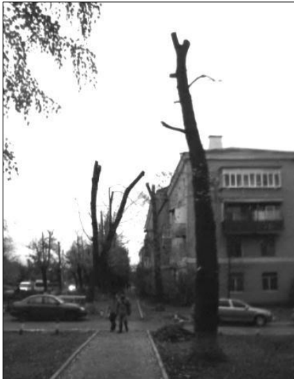
Рис. 4. Боротьба з омелою у населених пунктах України (на прикладі м. Харків)

Економічні затрати за сценарієм 2 за 20 років представлено у табл. 1 – 2.