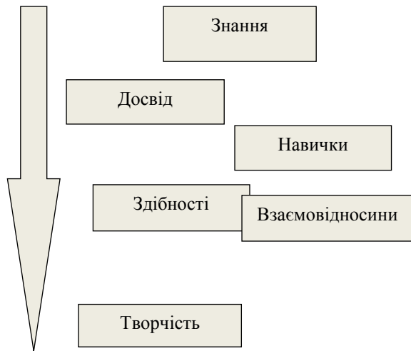
Рис. 1. Структурні елементи інтелектуального капіталу [3]

З точки зору визначення поняття інтелектуального капіталу, цікавою є думка Кандюхова О.В., який говорить про інтелектуальний капітал будівельних підприємств як здатність інтелектуальних ресурсів будівельного підприємства самостійно створювати інтелектуальні продукти або як спосіб отримання інноваційних інтелектуальних продуктів, що вже є на ринку [6,7].