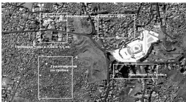
Рис. 1. Аэрофотосъемка Мекки (Саудовская Аравия)

Идеология модернизма, широко распространившаяся в этом регионе в 60-80-е гг. XX века базировалась на весьма радикальных принципах. В их число входили идеи свободной микрорайонной планировки, сетевой принцип размещения объектов