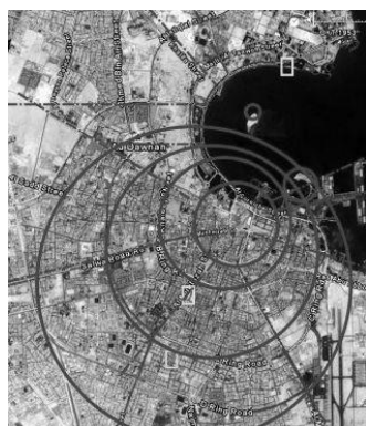
Рис. 4. Планировка г. Доха (Катар)

Радикально меняется система городских улиц. Например, город Эль Кувейт (рис. 3). Вокруг старого центра, расположенного как правило на мысу, выходящем в море, на месте старой крепостной стены разбиваются полукруглые бульвары, от которых развивается радиальная сеть широких улиц. Она плавно переходит в почти прямоугольную сеть магистралей, пересекающих территорию на примерно равные кварталы. Однако это не периметрально застроенные как в Европе кварталы, а плотно заполненные массивы. На схеме видно, что эта система планировки была заложена в 1964 г. По сравнению с описываемым периодом в настоящее время г. Эль Кувейт с птичьего полета представляется как четко структурированный и достаточно однородно застроенный.