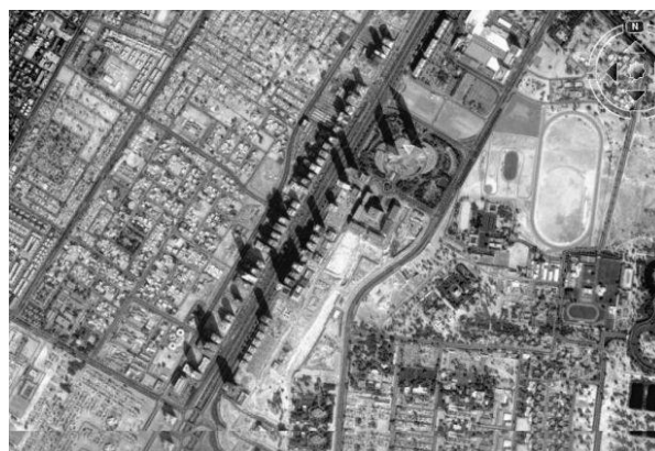
Рис. 5. Проспект Шейх бин Заед в Дубай (ОАЭ)

самбли (Министерства образования, Доха-телеком, Корниш, Сити-центр, набережная в районе гостиницы Шератон и др.) контрастирующие мелкой индивидуальной застройке частных домов. Редкими вкраплениями в новую городскую ткань смотрятся старые рынки, мечети и дворцы (например, рынок Вакиф, мечеть Аль Кубиб и дворец эмира, превращенный в музей).