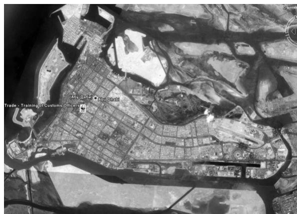
Рис. 6. Аэрофотосъемка Абу-Даби (ОАЭ)

Новый город Дубай представляет собой систему проспектов, формирующих сектора большой площади, застраиваемые гигантскими комплексами. Старый город составляет маленький контрастный фрагмент в структуре нового города. Например, проспект Шейх бин Заед (рис. 5), образованный небоскребами, контрастирует низко-этажной мелкоячейковой застройке.