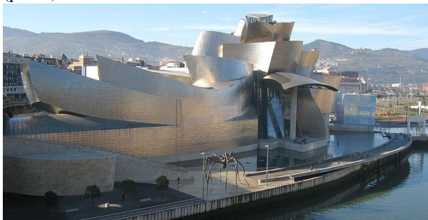
Рис.1. Музей Гуггенгайма в Більбао, Танцюючий дім Френка Гері.

Одними з найбільш знакових сучасних споруд і містобудівних комплексів, що відображають ідеї нелінійної парадигми світу, а також сучасні досягнення в галузі розвитку інформаційних комп'ютерних технологій, сучасних будівельних технологій і нових матеріалів є: Музей Гуггенгайма в Більбао (рис.1), Танцюючий дім Френка Гері, Галісійське Місто культури Пітера Айзенмана, Корейська пресвітеріанська церква в Нью-Йорку Грега Лінна, роботи архітектурного бюро Захі Хадід (рис.2).