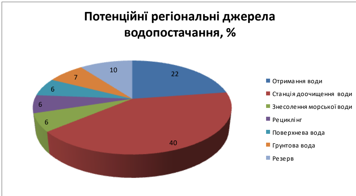
Рис. 1.1 –Джерела регіонального постачання міста Сан-Дієго, США, 2002 рік.