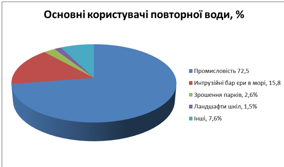
Рис.1.3 – Основні користувачі фільтрату.

Прийняття рішень на основі співвідношення витрат і вигод або середніх витрат на одиницю продукції може призвести до неекономічних, негабаритних проєктів[11]. Метою економічного