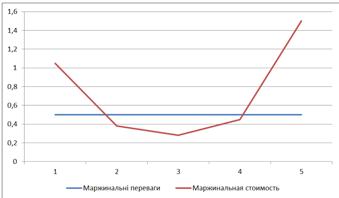
Рис. 1.4- Вплив маржинальної вартості на розмір проєкту

аналізу є визначення проєкту, який має найменшу вартість або чисті вигоди. Субсидії, такі як гранти або знижки, отримані від зовнішніх джерел, не повинні бути включені в аналіз.