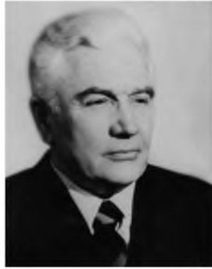
Е. П. Тамм, 1980-е гг.