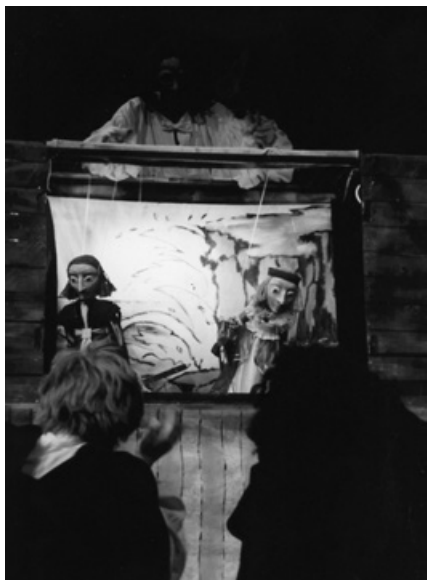
6. Вистава «Віра жебраків» за творами П. Брейгеля

Пітера Брейгеля старшого. Оригінальний сценарій було написано Борисом Чуприною та Тобі Вілшером (Англія). Романтична та досить трагічна історія двох майстрів що втратили свій зір, але не волю та любов до життя. Вони мандрують по світу і грають для людей веселі лялькові вистави. Якоюсь мірою незвична практика, коли автори мали за першоджерело не літературний, а живописний матеріал, виявилась вдалою. Вистава, що була створена, колективами двох театрів мала не аби який успіх у Великій Британії на сцені «Елізабет-холу» (Лондон), та згодом в Україні: Києві, Одесі, Миколаєві, Херсоні.