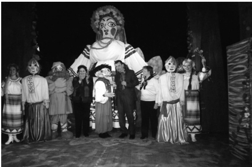
2. Героїчні пригоди Котигорошка. Автор п'єси та режисер Борис Чуприна

Деякі роки тому колектив обласного Херсонського театру ляльок під керівництвом головного режисера Заслуженого артиста України, доцента кафедри української культури та театрального мистецтва Херсонського державного університету Бориса Чуприна, поставив перед собою завдання: створити репертуар з найвідоміших творів світової класики для дітей. Але не за мотивами цих творів, як часто роблять сучасні драматурги, коли неможливо зрозуміти де закінчується О. Генрі і починається Іванов, а максимально зберегти сюжет, стиль автора і дуже делікатно адаптувати його для сцени театру ляльок.