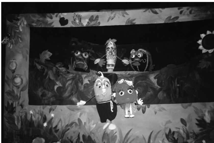
4. Пригоди агента Огірка (дітям про податки). Автор п'єси та режисер Борис Чуприна