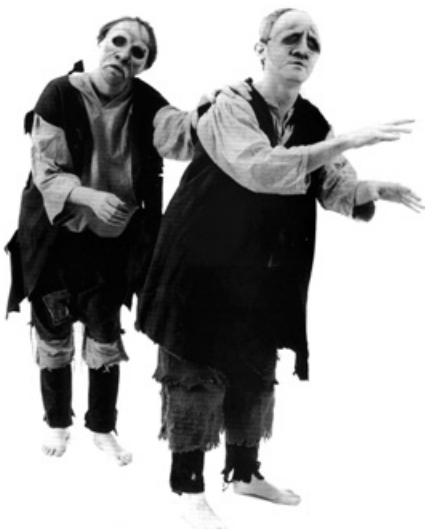
7. Робочий момент вистави «Віра жебраків»

Бабе», де автор вдало розкриває майже не відомі широкому колу глядача народні забави та ігри мешканців центральної України минулого сторіччя.