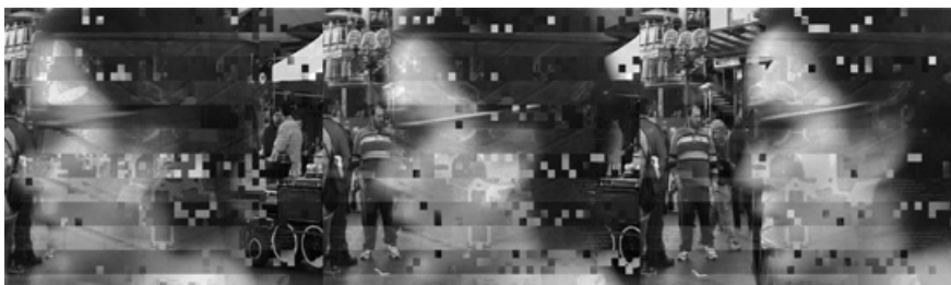
5. Оксана ЧЕПЕЛАИК. «Урбаністична Мультимедійна Утопія_УМУ», дигітальний друк, 75 x 104 см, 2002

волічним значенням — для міст Східної Європи європеїзація — культурний код, який, в той же час, є процесом нормалізації. Ті країни, що реалізували ці зміни найбільш успішно, тепер класифікуються як «звичайні європейські країни». Однак, європеїзація є не стільки поверненням до Європи, скільки переорієнтацією в межах нової географії; розширення ЄС для нових членів супроводжувалось підключенням до складної інституційної, юридичної та економічної політики. Відповідно до специфічних наслідків цього процесу підключення програма ЄС Урбанізм буде займатися пошуком відповідей на наступні питання: Як євро-інтеграційні процеси впливають на міста та урбаністичну культуру? Яким чином традиційні структури та ідеї стосовно «європейського міста» [4] співвідносяться з сучасними трансформаційними урбаністичними