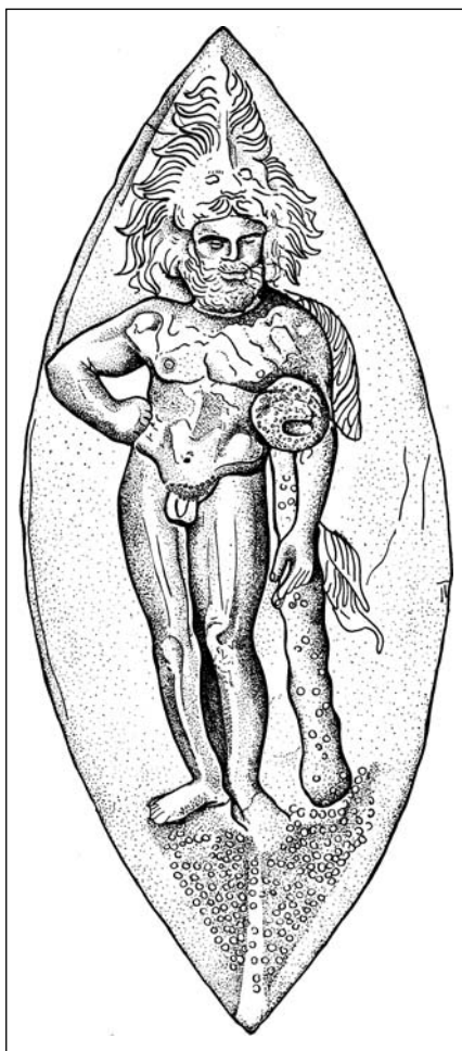
Фігура старого Геракла на срібному позолоченому кінському налобнику з Бабиної Могили

Оголений герой стоїть на невисокому узвишші, яке, можливо, імітує постамент. Лець нахилена голова у лев'ячому шоломі з високим позолоченим гребенем повернена до лівого плеча. Пишне хвилясте волосся закриває вуха і спускається на шию. Округлої форми борода і довгі вуса єдиною, майже не-