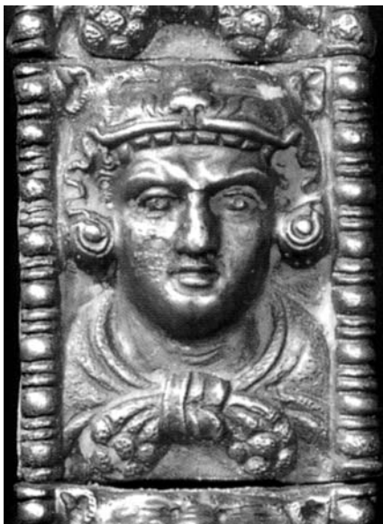
Бюст Геракла на срібній пластині від повіддя з кургану Бабина Могила

вироби, найвірогідніше виконаних одним майстром.