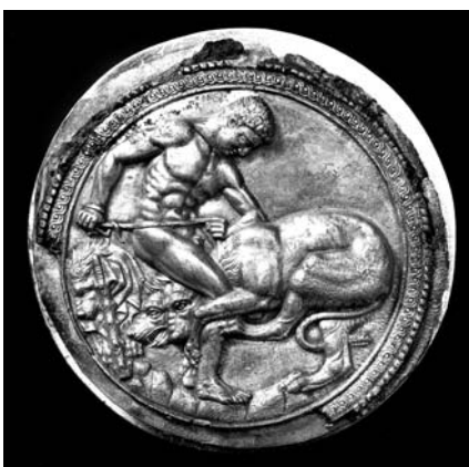
Двобій Геракла з Цербером. Срібний фалаф з Бабиної Могили

Обидві композиції закомпоновані в коло, декороване плетінкою і перлинником. Сцена двоюбою Геракла з немейським левом збереглася фрагментарно, попри те, можна скласти уявлення про її побудову і манеру виконання [26], а також віднести її до п'ятого іконографічного типу .