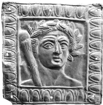
Золота аплікаційна пластина з зображенням бюста Геракла в вінку з білої тополі. Курган Велика Близниця

Вага тіла перенесена на праву ногу і палицю зі згорнутою шкірою лева, на яку спирається лівою рукою Геракл. Ліва нога ледве висунута вперед. Цей прийом постановки фігури додає тілу легкий вигин, зсув лінії стегон. Права рука зігнута в лікті й спирається стиснутим кулаком у бік, ліва з палицею опущена додолу. В композиції ясно відчутна хіастична побудова — напружена права нога і ліва рука і, відповідно, ослаблена ліва нога і права рука. Мотив зігнутої в лікті