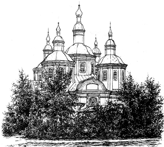
Собор в Старобільську. Малюнок С. А. Таранушенка, 1928. Архів С. А. Таранушенка, ЦНБНАНУ

Для висвітлення історії мистецького процесу на Луганщині важливі як друковані праці, так і архівні документи фонду С. А. Таранушенка Інституту рукопису Національної бібліотеки ім. В. І. Вернадського. У рукописних матеріалах і фототеці збереглися відомості про очолювану вченим експедицію 1928 р. до Старобільського повіту (тепер Луганська обл.).