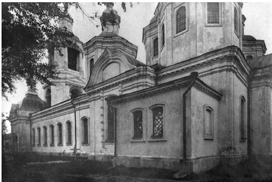
Собор в Старобільську. Видляд з південно-східного кута. 1928.