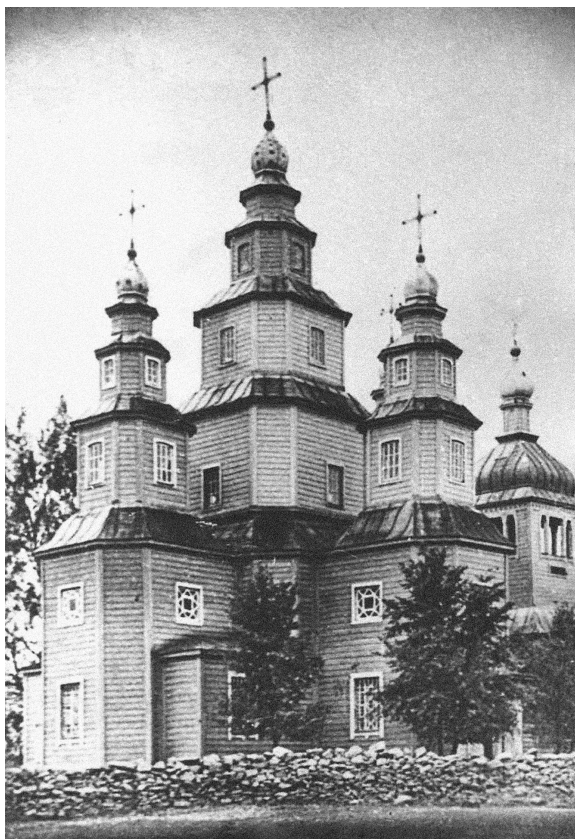
Михайлівська церква в Осиновому.