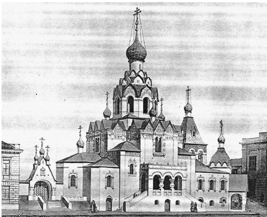
Проект церкви для Луганська. Північно-східний фасад. Архітектор В. В. Сулов, 1915

тецтва старої Слобожанщини», табл. XXIV). Верхні частини башт виконано в характері українських церковних бань. Але Старобільський собор має ту істотну від попередніх пам'яток відміну, що його план складається з 4-кутника, розбитого на дев'ять дільниць, його чотири менші бані перекривають куток планового чотирикутника і орієнтовані по сторонах світу, на південь-захід, південь-схід і т. д., чого в дерев'яних пам'ятниках на Україні ніколи не зустрічаємо і що є характерною рисою російського будівництва» [9].