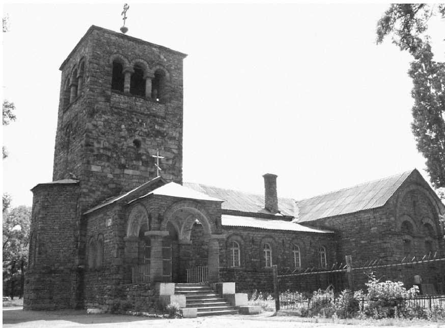
Храм в Селезньовці. Фото 2007

штовані хори. Для входу на них — сходи по дев'ять оборотів. На главах купола і веж — залізні хрести з кулями з листового заліза, позолочені і прикрашені залізними ланцюгами ... До слова сказати окремої дзвіниці немає. Дзвони розміщені у двох західних вежах» [14].