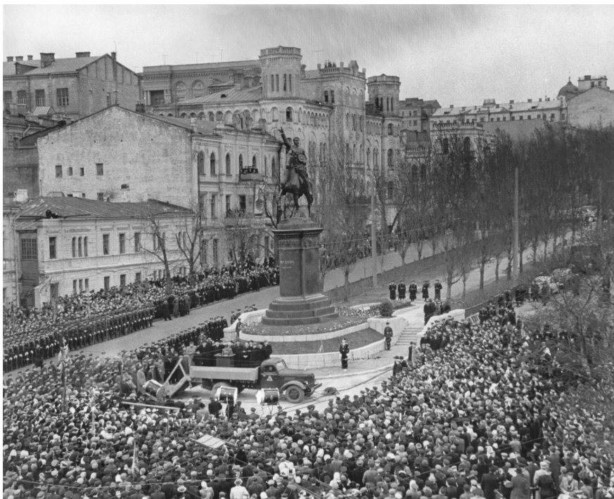
Відкриття пам'ятника М. О. Щорсу у Києві 30 квітня 1954 р.

Пам'ятник М. О. Щорсу у Києві. Авторська група: М. Г. Лисенко, М. М. Суходолов, В. З. Бородай. Архітектори: О. В. Власов, О. І. Заваров. 1954. Бронза, граніт. Висота 13,8 м.