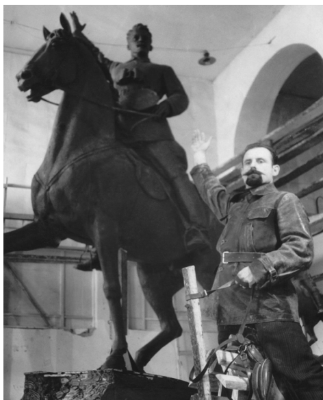
Позуюча натура і модель пам'ятника М. О. Щорсу у Власівських майстернях. Київ, 1953.