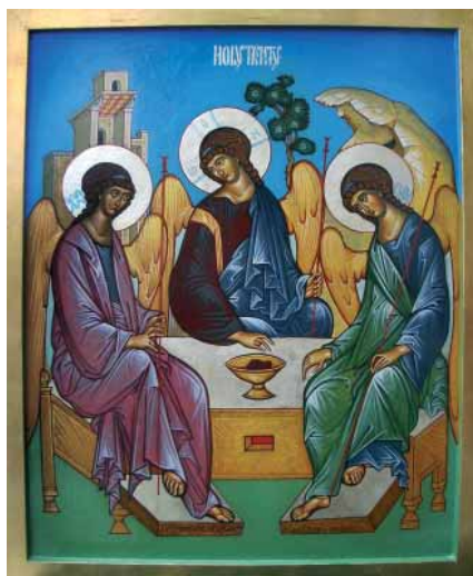
А. Харон. Икона «Пресвятая Троица». 2008. Холодная энкаустика. Сан-Франциско, греческий храм Пресвятой Троицы.