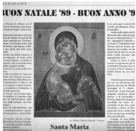
Праздничная рождественская газета 1989/1990 г. Ватикана с изображением иконы Богоматери Владимирской, написанной А. Хароном

Поскольку иконописец изображает человеческую природу Иисуса Христа Спасителя нашего, постольку он уловляет Благодать изобразить Божественную природу, Единосущного Отцу Сына Божия. На VII Вселенском соборе (787 г.), в городе Никеи было восстановлено и утверждено почитание святых икон, а иконоборчество — одно из проявлений монофизитской ереси, предано анафеме. Церковь установила празднование иконопочитания и торжество Святого православия в первое Воскресенье Великого поста.