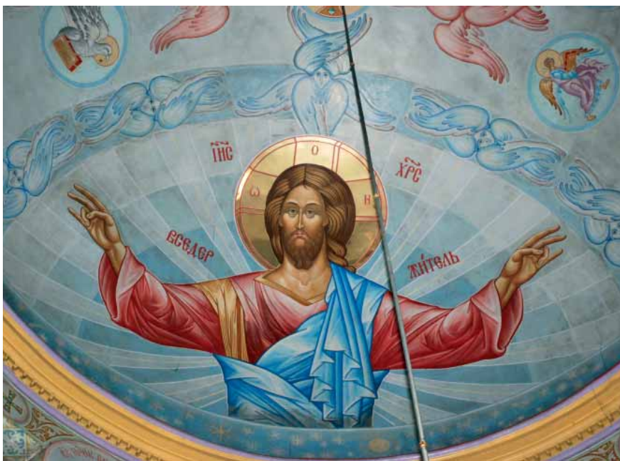
А. Харон. Образ Христа Пантократора. 1977. Холодная энкаустика. Одесса, роспись купола храма Рождества Пресвятой Богородицы.