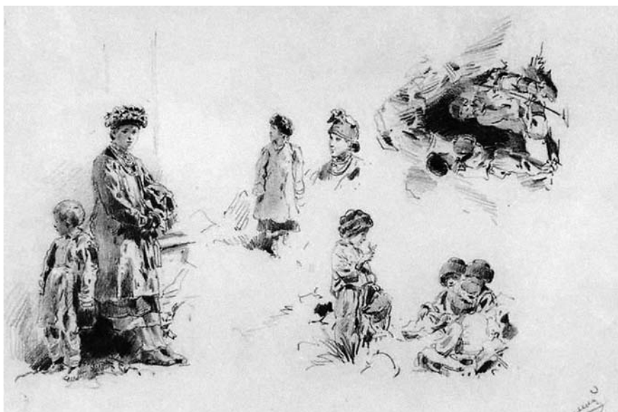
В. Маковський. Начерки з натури, виконані в Україні. 1882. ХХМ

«Ставок» і «Парк взимку» Альберта Бенуа, одного із засновників Товариства російських акварелістів, сепії «Біля моря» і акварелі «Пейзаж» академіка архітектури Леонтія Бенуа, акварелі «Убита куріпка» Катерини Лансере (?), шістьох робіт їх батька — архітектора Миколи Бенуа [12]. Натомість, на підставі відсутності на 12 рисунках, що раніше були віднесені до колекції Жемчужникова, номерів ДРМ, а також номерів з авторського опису Жемчужникова, їх було виключено з цієї збірки (твори К. Брюллова, І. Айвазовського, О. Кіпренського, Л. Жемчужникова та ін.).