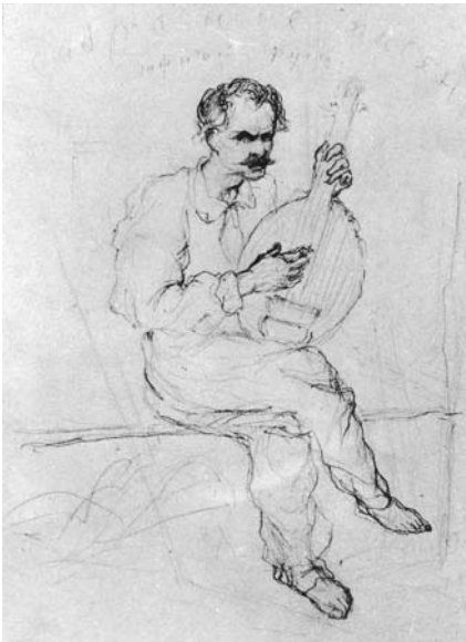
Л. Жемчужников. Кобзар Остап Вересай. Рисунок до офорту № XIII з альбому «Живописна Україна». ХХМ