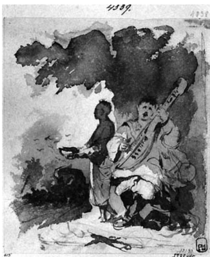
А. Жемчужников. Кобзар під деревом біля дороги. ХХМ