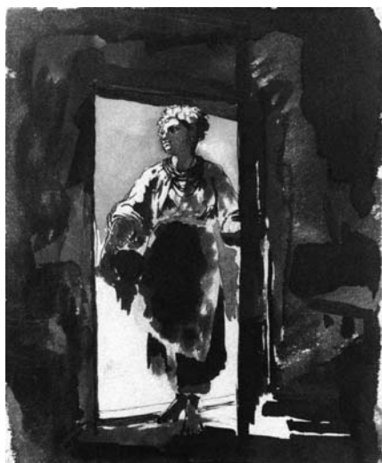
А. Жемчужников. Українська дівчина, що входить після роботи до сіней. ХХМ

Жемчужников» рисунок названо автопортретом Жемчужникова, який насправді є роботою О. Бейдемана, акварель «Седнів. Майстерня, де працював Т. Шевченко», насправді є зображенням майстерні Жемчужникова у Сокиренцях, акварель Жемчужникова «Авторпортрет» — за описом виконаний О. Бейдеманом портрет Жемчужникова. Ціла низка рисунків з колекції, які приписувались А. Жемчужникову, у дійсності є творами О. Бейдемана (вже згадані портрети Жемчужникова, «Козак у степу») і А. Лагоріо («На полювання»), автором деяких творів Бейдемана виявився Жемчужников. Довгий час не атрибутована низка малюнків є ескізами ілюстрацій Жемчужникова до роману П. Куліша «Чорна рада» [11, с. 30]. Ці ескізи, а також два начерки ілюстрацій до «Мідного вершника» О. Пушкіна та «Князя Срібного» О. Толстого демонструють дослідникам невідому грань таланту Жемчужникова як художника-ілюстратора.