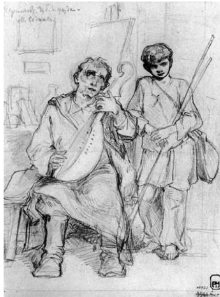
Л. Жемчужников. Сліпий кобзар з поводитирем у кімнаті Л. Жемчужникова у Седневі. Рисунок до офорту № V з альбому «Живописна Україна». ХХМ

супроводжувався пояснювальним текстом. Як зазначає дослідник російської гравюри колекціонер Д. Ровінський, усі 50 гравюр до альбому були власноруч витравлені й надруковані Жемчужниковим.