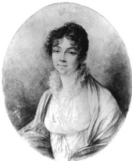
О. Кіпренський. Жіночий портрет. 1818. ХХМ