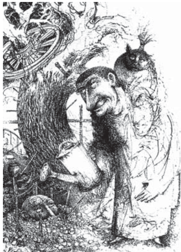
Володимир Кири'янов. Визрівання. 1995. Папір, туш