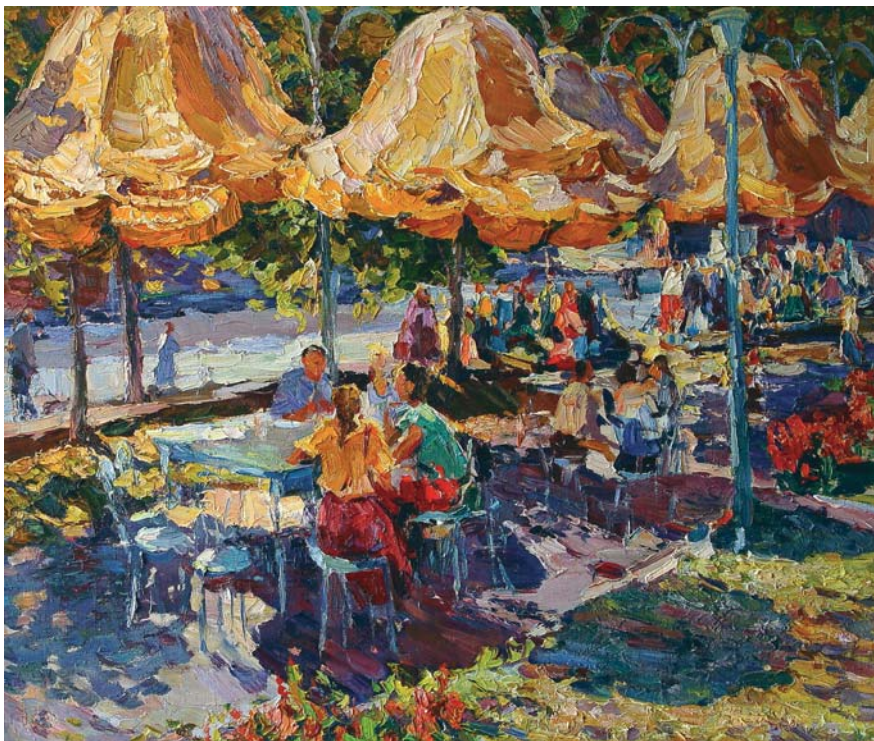
Сергій Шаповалов. Сонячні Парасольки. 1989. Полотно, олія. (Зі збірки Кіровоградського обласного художнього музею)