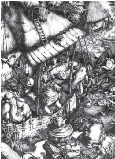
Володимир Кири'янов. Ілюстрація до повісті М. Гоголя «Як посварилися Іван Іванович з Іваном Никифоровичем». 1994. Папір, туш.