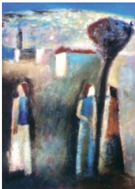
Ігор Смічек. Дорога. 2000. Полотно, олія