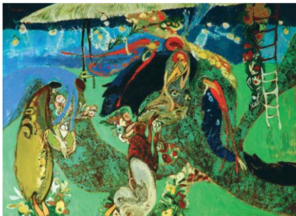
Григорій Гнатюк. Листи з Біблії. 1995. Полотно, олія