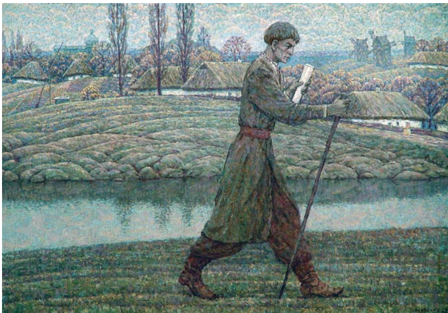
Борис Вінтенко. Портрет Григорія Сковороди. 1972. (Зі збірки Кіровоградського обласного художнього музею)