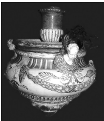
Панікадило з херувимами виробництва КМФФ. Фаянс, скульптурний декор, рельєф, профізування, люстрування. Зб. ДНІМ, НМУНДМ