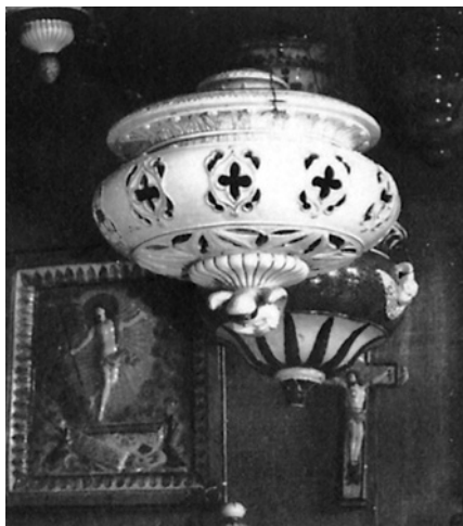
Курильниця виробництва КМФФ. Зб. НМУНДМ