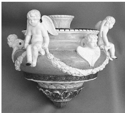
Кадило з янголятками і серафимами виробництва КММФ. Фаянс, скульптурний декор, рельєф, кольорова полива, люстрування. Зб. ДНІМ, НМУНДМ