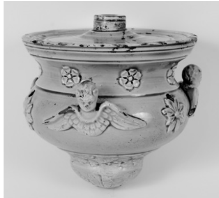
Лампади (у тому числі поліхромна) виробництва КМФФ з різним вирішенням верхньої частини. Привертає увагу різне положення крил херувимів. З колекцій НМУНД і СХМ