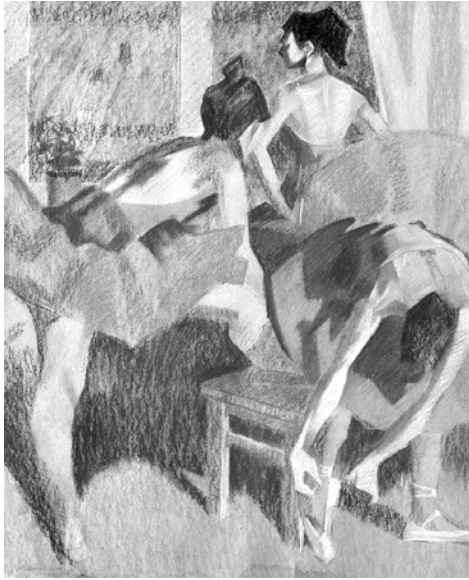
К. Ломикін. Перед виступом. Танцівниці у червоному. 1985. Картон, пастель

пластику римованої мелодики. Цей мистецький діалог наповнює простір полотен знаковими символічними інколи майже монохромними акцентами наявності нетлінної нерухомості художньої істини: відчуття прекрасного в мистецтві — це поступ особистісного прагнення до одвічної тендітної недоторканої недовсяжності, бо, за обраними В.І. Братанюком драматичними сюжетами «Роздуми», «Сльози творчості», — служіння мистецтву вимагає особливого наполегливого відношення до оволодіння мовою танцювальної естетики.