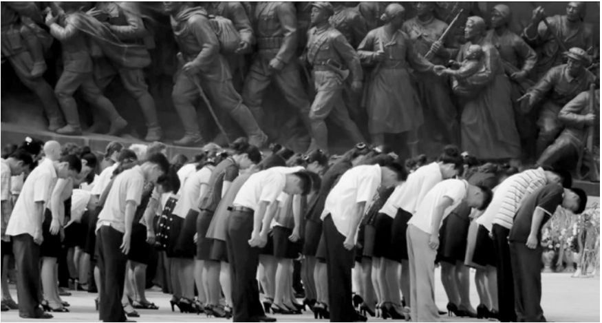
Угіс Олте, Мортен Траавік. День звільнення. Норвегія, Латвія, 2016

Вважається, що група «Лайбах» відкрила проект під назвою комунізм і зруйнувала Варшавський блок без жодного пострілу. Таким чином, підірвні стратегії The Yes Men у фільмі-відкриття, римуються з підірвними стратегіями групи «Лайбах» у фільмі-закриття, утворюючи символічне кільце фестивалю Docudays UA, де межа між мистецтвом, активізмом та роботою з суспільними проблемами є розмитотою.