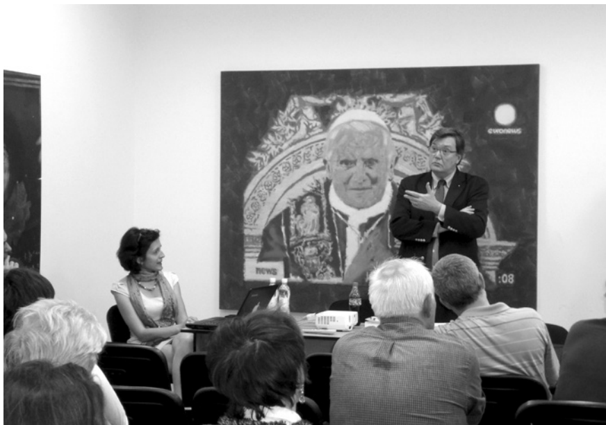
Блер Рубл читає лекцію в ІПСМ НАМ України. 1 червня 2012 року