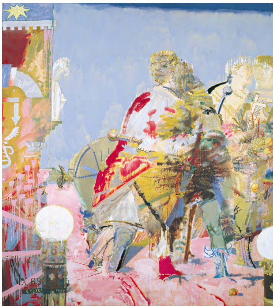
Oleg Tistol. Reunion. 1988. Płótno, olej, 270 × 240 cm (z kolekcji PinchukArtCentre, Kijów)

tualizmu, z osiągnięciami ukraińskiej szkoły malarskiej, ukraińskiej awangardy początku XX wieku, z grafiką Georgija Narbuta/ Heorhiy Narbut, a także z ukraińskim malarstwem ludowym. Bogata w różnorodne aluzje historyczne, kulturowe i wizualne, twórczość Tistola przyciąga uwagę właśnie dzięki wysiłkowi artysty, aby przekazać całe spektrum symbolicznego kręgu, który stanowi o ukraińskiej tożsamości narodowej.