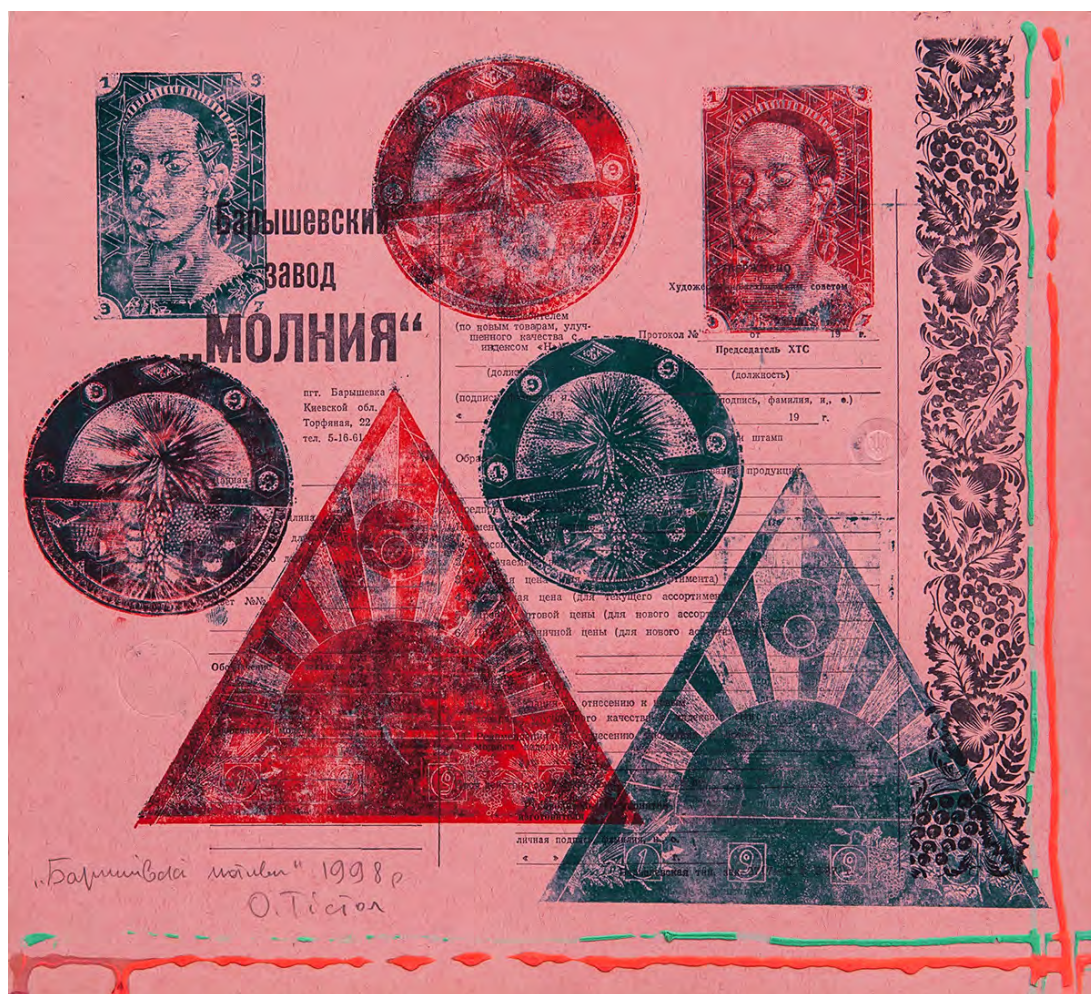
Oleg Tistol. Motywy Baryshivki '1. 1998. Akwaforta, wysoki druk, 30 × 32 cm

stereotypu” — zarówno wizualnego, jak i stereotypu percepcji — dotyczącego przede wszystkim historii Ukrainy. Zatem Tistol jak wielu innych ukraińskich artystów realizuje dążenie sztuki do uniwersalności i ogólności poprzez eksplorację tego co lokalne, narodowe: urzeczywistnia tym samym idee sztuki jako odpowiedź na popularny i przywieziony z Moskwy soc-art.