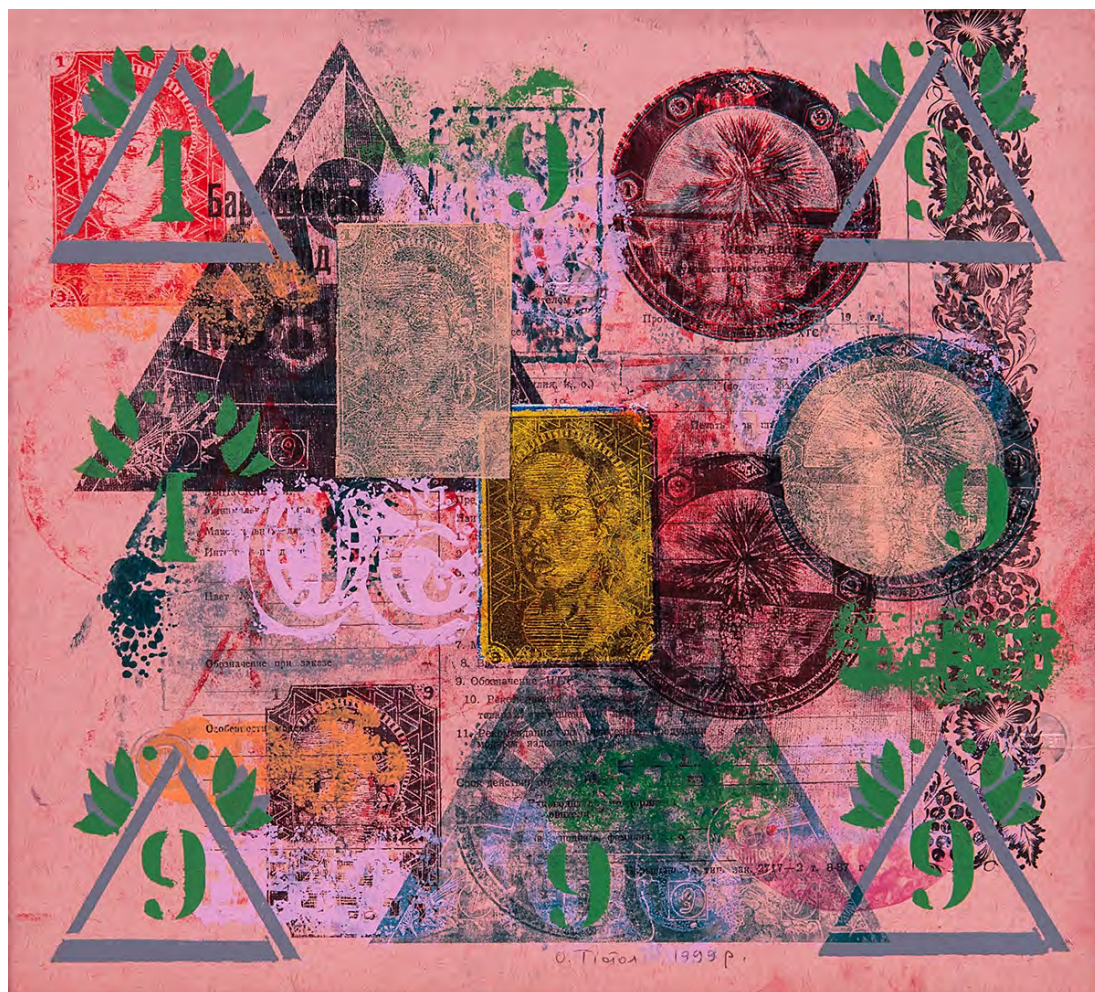
Oleg Tistol. Motywy Baryshivki '2. 1999. Akwaforta, wysoki druk, 30 × 32 cm

spowodowało przyśpieszone, przywłaszczenie doświadczenia, coś w rodzaju „eksternistycznego” kursu, który w 10 lat miał odrobić to co Europie zajęło niemal lat siedemdziesięciu lat (od 1930 do 2000 roku). Umożliwiło to ukraińskim artystom płynne i przekonujące włączenie się do globalnego nurtu kulturowego, umożliwiło posługiwanie się językiem zrozumiałym dla świata sztuki współczesnej. Malarstwo ponownie doszło do głosu, teraz już w nowatorskiej przestrzeni i samo rozumienie malarstwa, jego realizowanie i funkcjonowanie, przez ukraińskich artystów stało się o wiele lepsze. U swych podstaw zbiegało się ono teraz z z znanymi na całym świecie pomysłami na temat uprawiania, znaczenia i roli tego rodzaju sztuki.