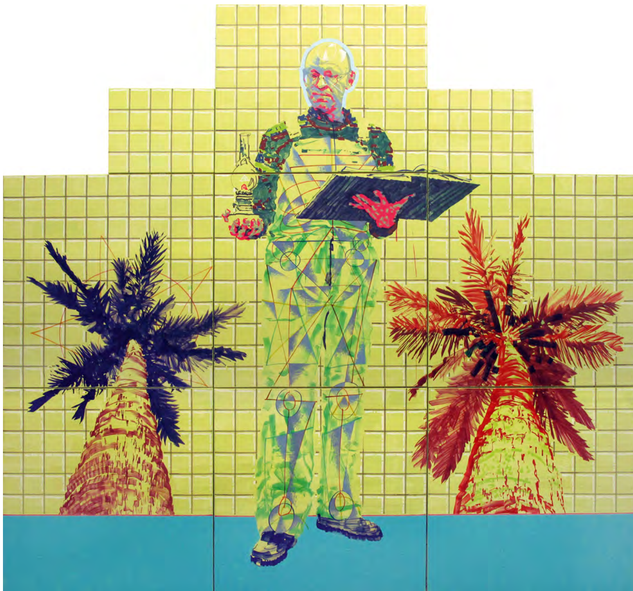
Oleg Tistol. Książka. 2013. Płótno, akryl, 280 × 300 cm

Tistol zajmuje ważne miejsce w ukraińskiej sztuce współczesnej, nie tylko jako część historii Nowej fali , ale także jako ważny moment artystycznej refleksji o ukraińskiej przeszłości. I jeśli figuruje w sztuce jako „osoba prywatnie szanowana” — a także jako główny zwornik „ukraińskiego postmodernizmu” skupiającego się na ogólnych kosmopolitycznych trendach i włoskiej transawangardzie, to jednak nadal pracuje w kręgu narodowej tradycji i ukraińskiego mitu, z utopiami tej tradycji, jej stereotypowymi symbolami. Właśnie dlatego jest on zwolennikiem estetyki plakatu, umowności, znaku stylistycznie bliskiemu pop-artowi. Ważne podkreślenie jest to, że Oleg Tistol zawsze podąża inną ścieżką niż pozostali współcześni artyści ukraińscy. Główną ideą jego prac pozostaje przepracowanie i przemyślenie ukraińskiej tożsamości oraz analiza ukraińskiej mitologii. To właśnie w ich tkwi nienaruszalne źródło narodowych wartości kultury Ukrainy. W ten sposób Tistol podkreśla jej znaczenie i miejsce w kulturze globalnej.