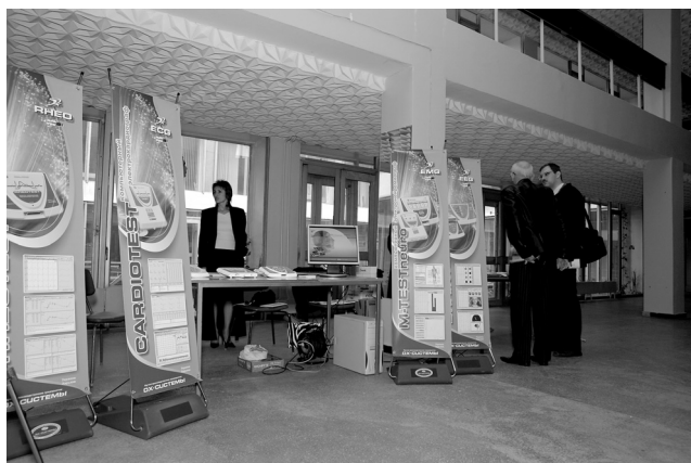
Выставка медицинских программных продуктов и компьютерных биотехнических систем.

Было также проведено объединенное заседание Ученого Совета УАКМ, Редакционной Коллегии и Редакционного Совета научно-методического журнала УАКМ «Клиничес-