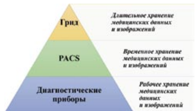
Рис. 1. Трехуровневая система хранения медицинских изображений.

Предложен подход к хранению и обработке медицинских изображений на основе трехуровневой системы хранилищ (рис. 1):