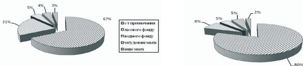
Рис. 1. Структура земельного фонду каньйону р. Дністер а) в межах Івано-Франківської області; б) в межах Чернівецької області

загальної площі області) визначається локальними особливостями в структурі земельного фонду та характеризується наступними показниками (рис. 1а): на землі сільськогосподарського призначення припадає – 59,0 тис. га (67,6 %), лісогосподарського – 18,0 тис. га (20,7 %), водного фонду – 4,4 тис. га (5,0 %), під забудованими – 3,6 тис. га (4,2 %) та малопродуктивними землями зайнято – 2,3 тис. га (2,6 %). Крім того, із усіх зазначених категорій земель виділяються землі особливого (природно-заповідного та іншого природно-охоронного, оздоровчого, рекреаційного та історико-культурного) призначення, площа яких становить 4,8 тис. га (5,5 %). Найбільша частка яких у Блюдниківській (46,5 %) та Тенетниківській (33,3 %) сільських радах Галицького району (рис. 2). Наближеними до пересічнообласного значення є показники у Побережській (5,7 %) та Козарівській (4,6 %) сільських радах Тисменицького та Рогатинського адміністративних районів, відповідно. Проте, у 17 радах (здебільшого, – у Рогатинському, Калуському та Тисменицькому районах), що становить понад 40 % від загальної площі досліджуваної території, частка земель особливого призначення повністю відсутня.