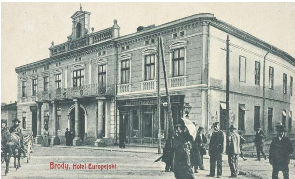
Brody, Hotel Europejski

Початок туристичного руху у Галичині припав на середину XIX ст., але найбільшого розквіту він набув у міжвоєнний період. Важливою і невід'ємною складовою туризму було влаштування закладів розміщення та харчування. Метою статті є характеристика особливостей функціонування готельного господарства на теренах Галичини у міжвоєнний період. Базою класифікацій готелів слугували окремі праці автора [1–3].