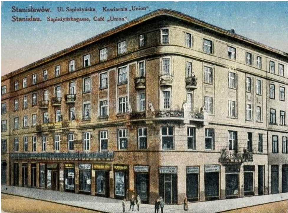
Готель «Уніон» у Станиславові