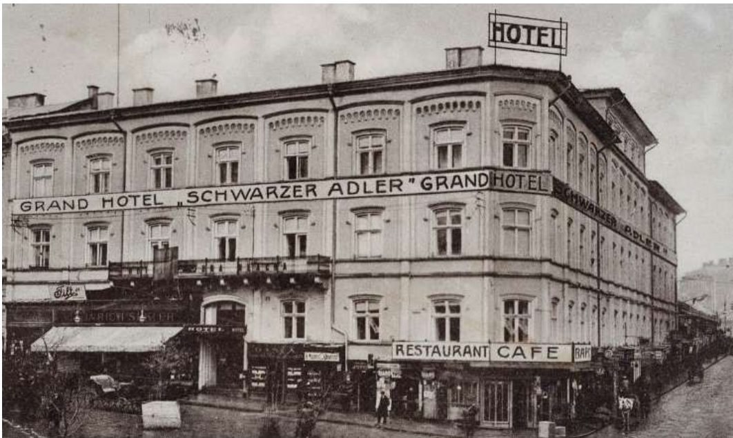
Готель «Чорний Орел» у Чернівцях