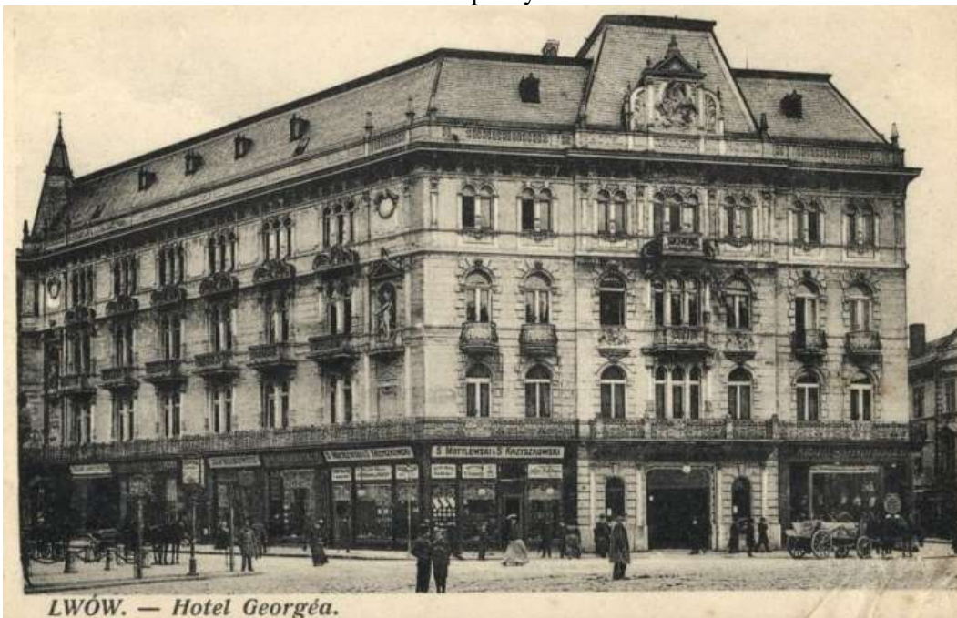
Готель «Жорж» у Львові