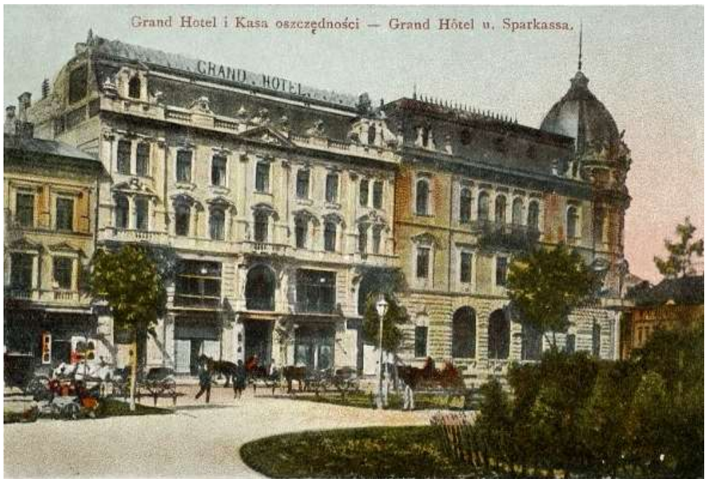
Гранд-готель у Львові

Grand Hotel i Kasa oszczedności — Grand Hôtel u. Sparkassa. Lwów — Lemberg.