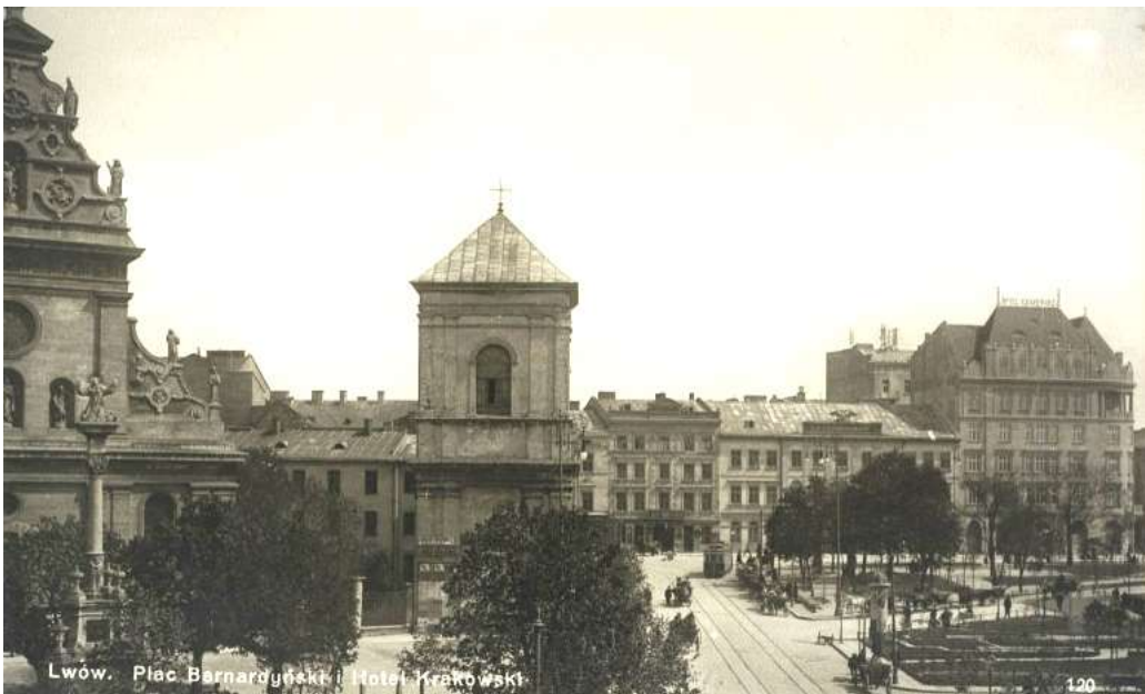
Готель «Краківський» у Львові