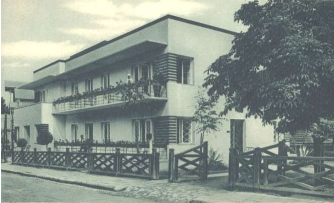
TRUSKAWIEC-ZDRÓJ. Hotel „Farys”.