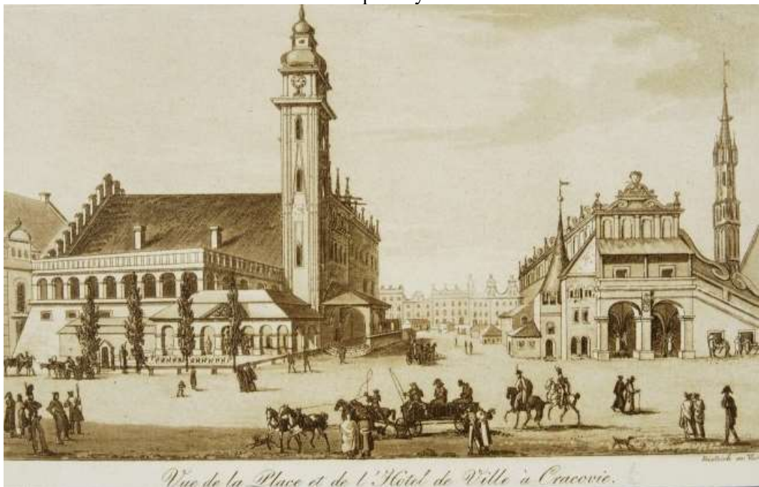
Vue de la Place et de l'Hotel de Ville à Cracovie.