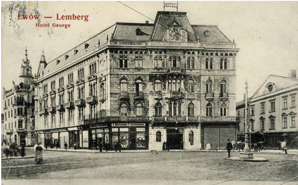
Готель «Жорж» у Львові