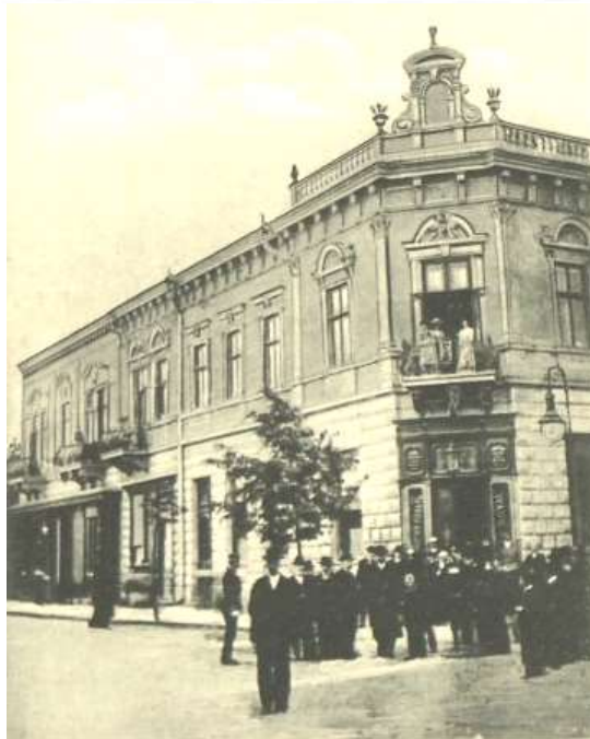
Коломѳа. — Kolomea. Kawiarnia Royalna i Hotel Imperialny. КОЛОМИЯ. Kaffee Royal und Hotel Imperial.