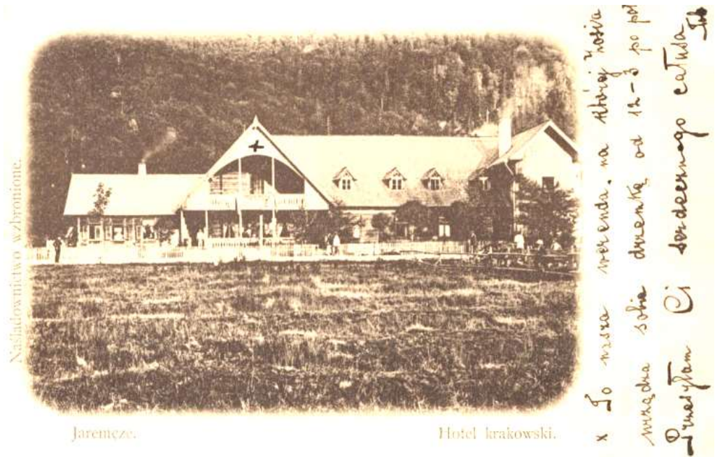
Готель «Краківський» у Яремчі

Туристів, що відвідували Карпати, окрім курортних лікарень, санаторіїв і пансіонатів з лікуванням, могли прийняти й численні готелі Галичини (табл. 1) [1, с. 147–156; 2, с. 33–112].