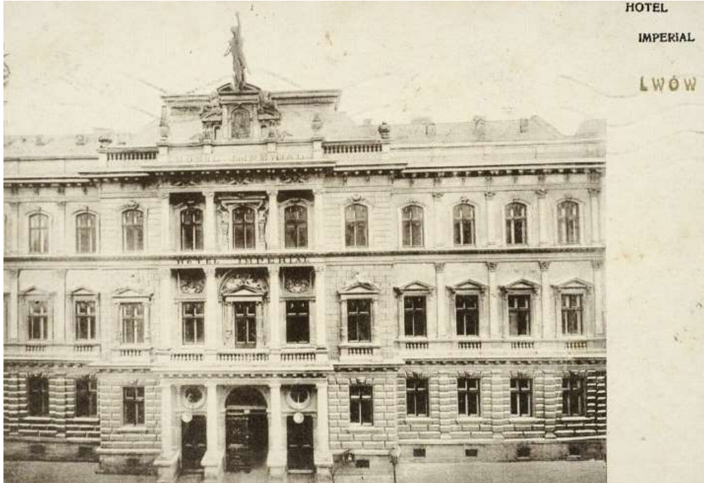
Готель «Імперіал» у Львові (1912 р.)