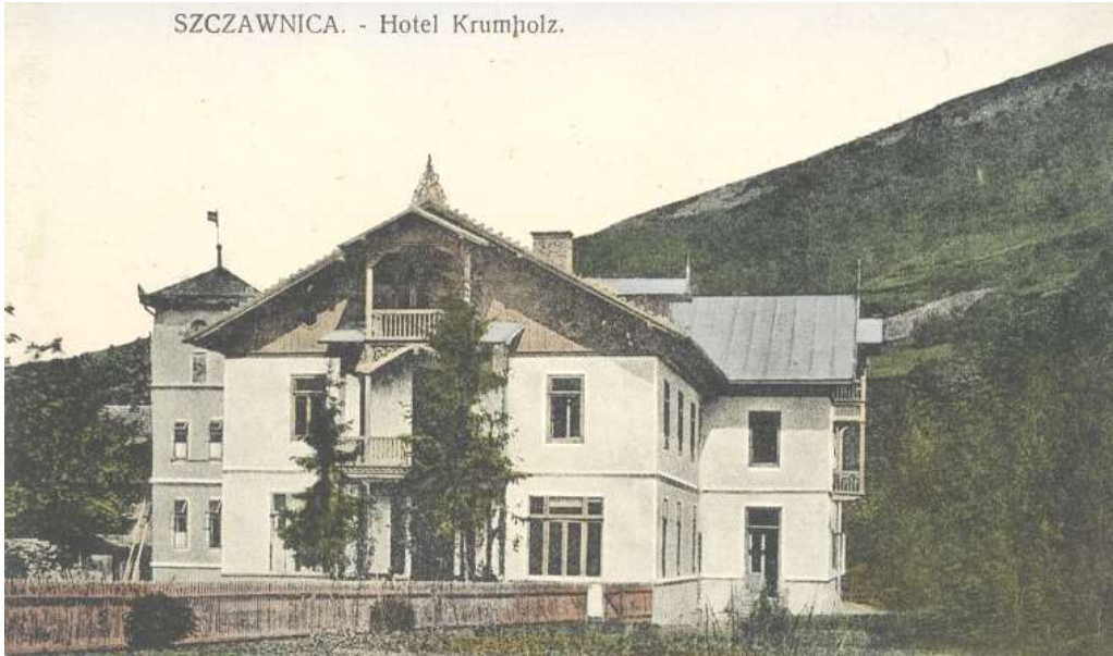
Готель «Крумгольц» у Щавниці