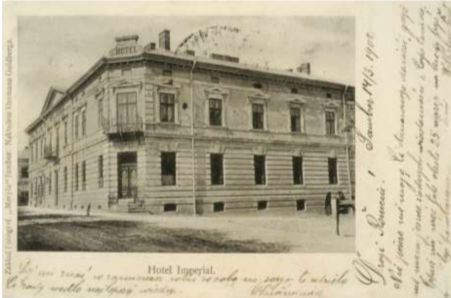
Готель «Імперіал» у Самборі