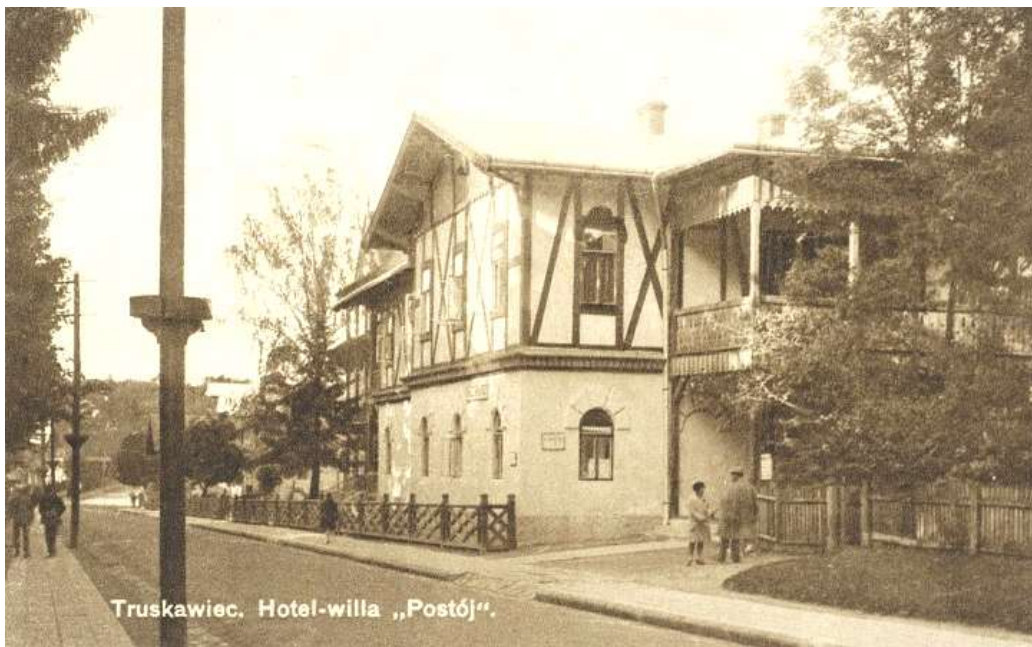
Готель-вілла «Постій» у Трускавці