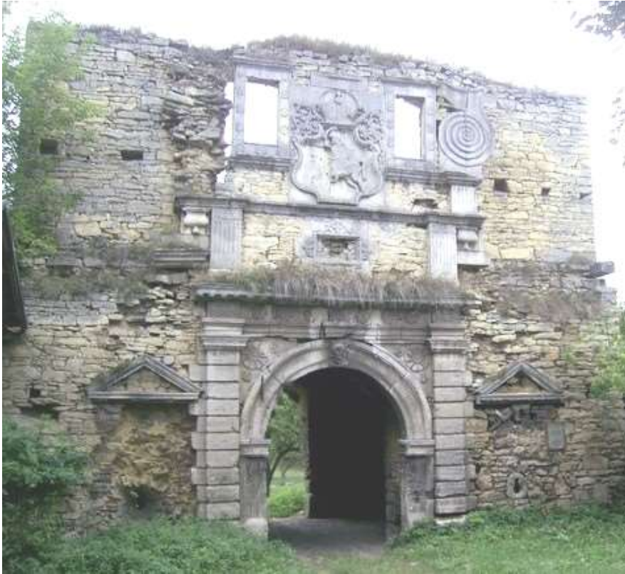
Рис. 3. В'їзна брама Чернелицького замку (автор – Р. Бречко)

Оборонний комплекс, зовнішні стіни якого збудовані з коленого каменю-пісковика, в різних дольових частках поєднав риси трьох архітектурних стилів (еклектизм) – практичного бароко, химерно-фантазійного маньєризму та вишуканого ренесансу, а їхні основні стильові ознаки яскраво відображені на порталі в'їзної брами споруди.