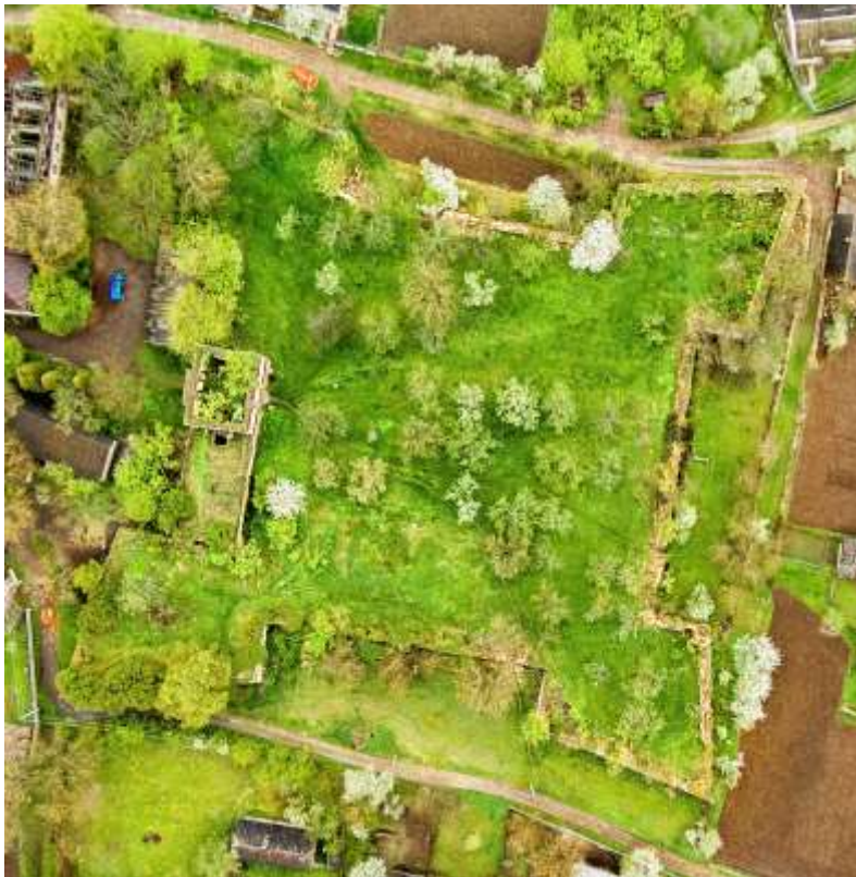
Рис. 1. Аерофотознімок Чернелицького замку (автор – М. Рітус)

схилами, які понижуються в північному, східному й південному напрямках, а тому південно-західний і північно-західний бастіони розміщені ближче до вершини кряжу, а північно-східний та північно-західний – на його схилі. Діапазон висот замкової площі коливається в рамках 308–315 м, що переважає навколишній рельєф на 2–10 м з північного, східного та південного боків й на 1–2 м із заходу. Така локалізація створювала додаткові орографічні передумови фортифікаційної міцності та обороноздатної ефективності (рис. 1).