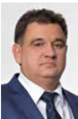
Професор Олександр Науменко, Президент Конгресу (Україна)

з різних країн зберуться у Києві щоб оволодіти інноваційними методиками діагностики та лікування захворювань в ЛОР-практиці