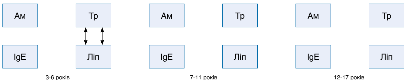
Рис. 3. Кореляція структури показників зовнішньосекреторної діяльності ПЗ та IgE у пацієнтів групи контролю (Ам – амілаза; Тр – трипсин; Ліп – ліпаза)