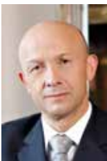
Професор Казімір Немчик, віце-президент Конгресу (Польща)

Окрім наукової програми, оргкомітет планує надати привабливу програму дозвілля в красивому та історичному місті.