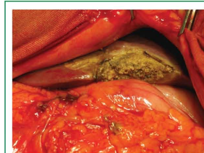
Рис. 2. Краевая биопсия печени с использованием генератора электросварки мягких тканей ЭК-300М1 (окончательный вид)