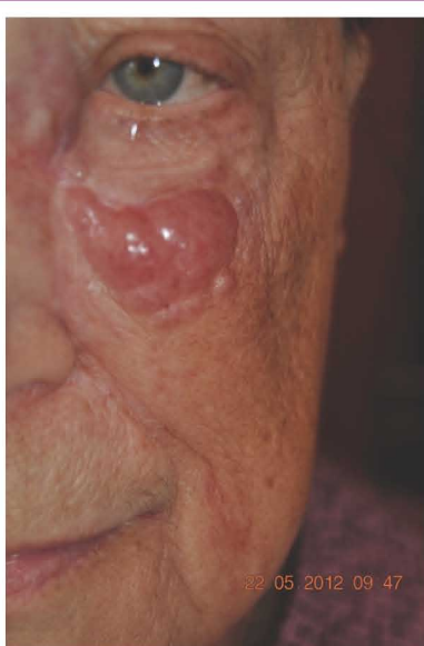
Рис. 2. КМ. Состояние после хирургического лечения, рецидив

39. Wong H.H., Wang J. (2010) Merkel cell carcinoma. Arch. Pathol. Lab. Med., 134(11): 1711–1716.