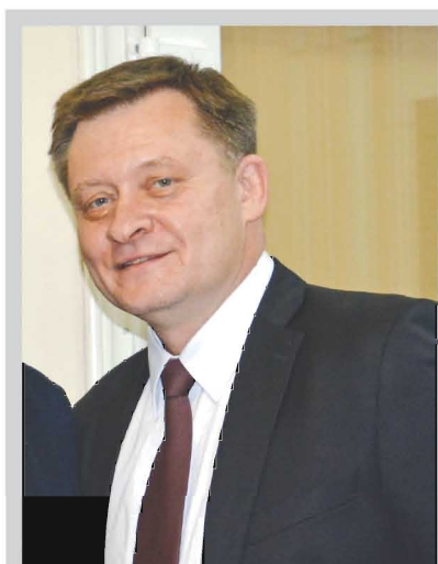
А.Б. Зіменковський 1 , М.М. Заяць 1 , В.І. Зайцев 2