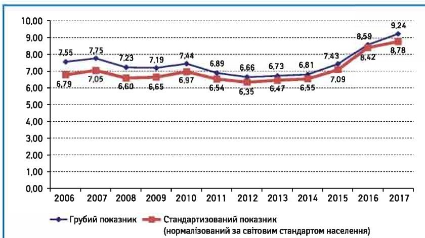
Рис. 3. Захворюваність на КРР (код МКХ С18-С20) населення вікової групи 20–49 років, Україна (показник на 100 тис. населення)

складним та довготривалим процесом, що потребує мультимодального підходу. За десятирічний період відзначено зростання захворюваності у 1,7 раза, що корелює з міжнародними даними (рис. 4).