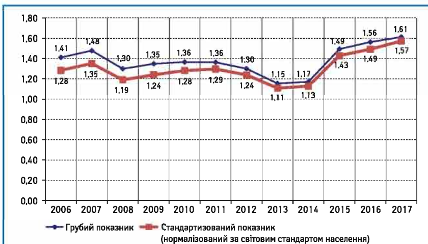
Рис. 4. Захворюваність на МПРПК (код МКХ С19-С20, Т3-4N1-2M0) населення вікової групи 20–49 років, Україна (показник на 100 тис. населення)

На сьогодні в онкологічній галузі України впроваджені стандарти діагностики та лікування, уніфіковані клінічні настанови, локальні клінічні протоколи, що затверджені наказом Міністерства охорони здоров'я (МОЗ) України від 29.04.2011 р. № 247 «Про внесення змін до наказу МОЗ України від 17.09.2007 р. № 554 (зі змінами) «Про затвердження протоколів надання медичної допомоги за спеціальністю «онкологія», наказу МОЗ України від 28 вересня 2012 р. № 751 «Про створення та впровадження медико-технологічних документів зі стандартизації медичної допомоги в системі