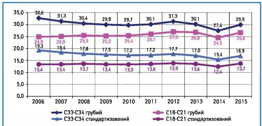
Рис. 2. Смертність від КРР порівняно зі ЗН легень, Україна (показник на 100 тис. населення)

лено, що у Сполучених Штатах захворюваність на КРР у пацієнтів молодше 50 років значно зростає. Науковці підраховували, що показники захворюваності на РТК та РПК до 2030 р. підвищаться на 90,0 і 124,2% для пацієнтів віком від 20 та 39 років відповідно. Наразі причина цієї тенденції невідома [3, 4].