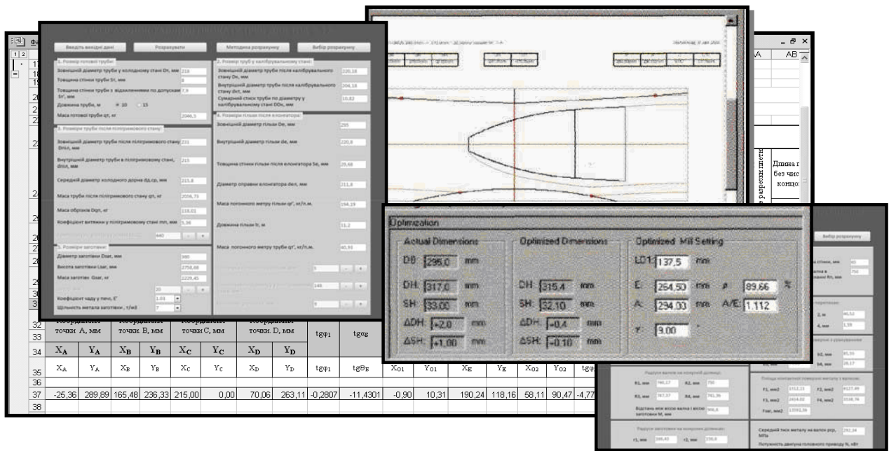
Рис. 4. Программа параметризации «конструкций» инструментов очага деформации стана-элонгатора

граммы твердотельного моделирования (КОМПАС-3D). После построения (изменения параметров) очага деформации стана-элонгатора в автоматическом режиме отображаются ранее рассчитанные узловые точки процесса. Параметры точек далее заносятся в геометрическую мо-