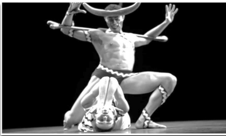
Фото 2. Балет «Errand Into the Maze», постановка Марти Грехем (Martha Graham Dance Company, New York, 2004)

Фото 1. Балет «Errand Into the Maze», постановка Марти Грехем (Martha Graham Dance Company, New York, 2004)