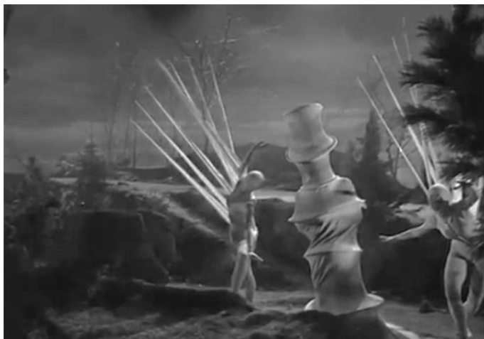
Фото 5. «Help, Help, the Globolinks!», постановка Дж. Менотті в Hamburg State Opera, 1968.

Фото 4. «Help, Help, the Globolinks!», постановка Дж. Менотті в Hamburg State Opera, 1968.