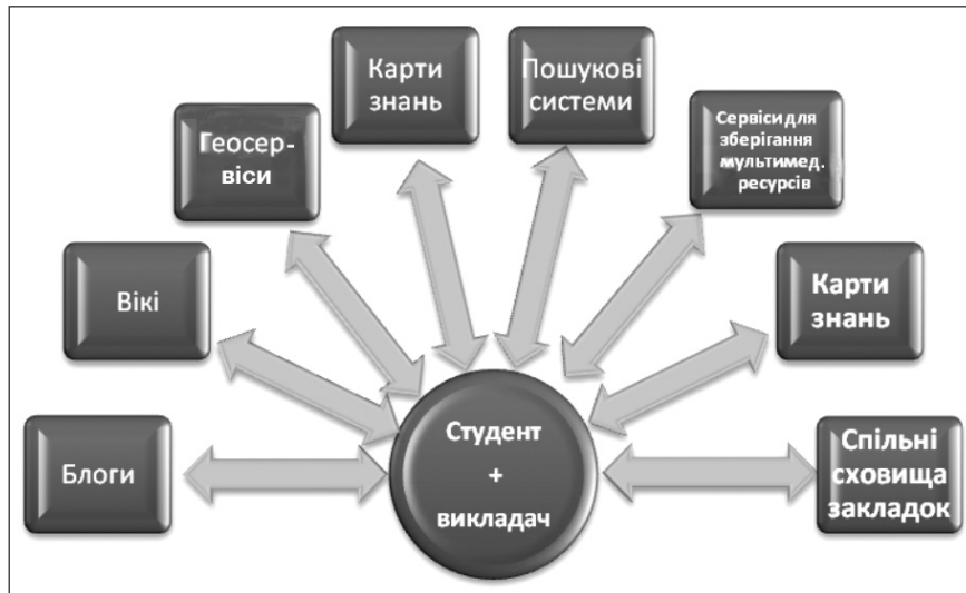
Рис. 1. Спільний віртуальний освітній простір викладача і студентів і студентів органічно поєднуються через соціальні сервіси: загальні сховища закладок, сервіси для зберігання мультимедійних ресурсів, блоги, вікі, геосервіси, карти знань, соціальні пошукові системи (рис. 1). Педагогіка мережевих спільнот, яка є новітнім напрямом теорії навчання, заснована на ключових положеннях [3], таких як:

1. Навчання визначається інструментами й об'єктами, якими користується студент.