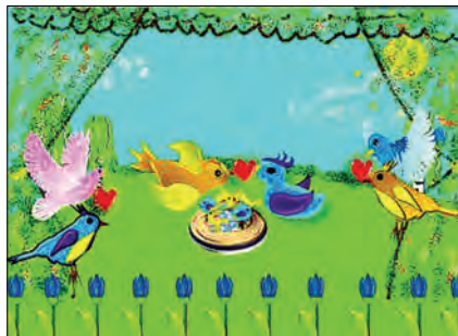
Рис. 8. Сім'я