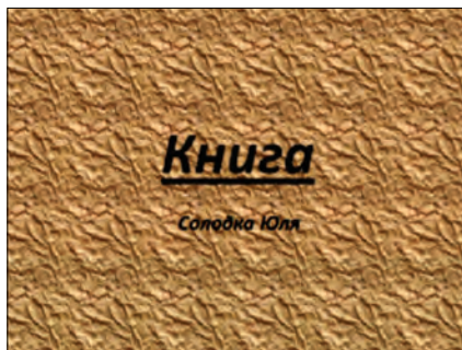
Рис. 12. «Що ми знаємо про книгу»