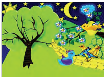
Рис. 7. Діти

ристовувати на уроках етики, Я і Україна, української мови та літератури, під час проведення виховних годин тощо.