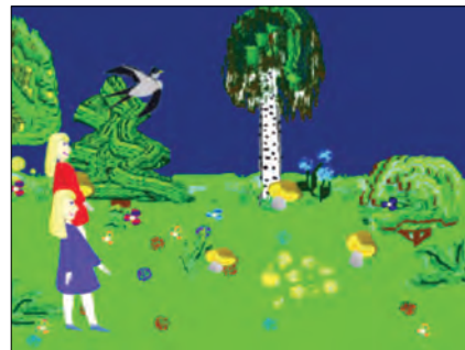
Рис. 2. Весна