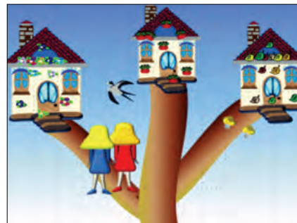
Рис. 4. Ми впевнені у собі