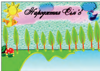
Рис. 10. Мультфільм «Народження сім'ї»