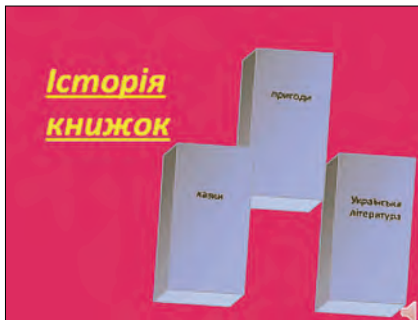
13. Мультфільм «Історія про книгу»