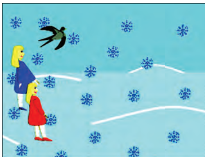
Рис. 1. Зима

Де знайти ідею для мультфільму? Ось вам невеличка підказка, де і як шукати цікаві ідеї та сюжети. Спробуйте протягом дня відзнача-