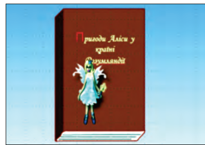
Рис. 11. Мультфільм «Бережи книгу»