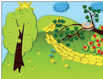
Рис. 6. Дім

Познайомитися з мультфільмами можна за посиланнями: