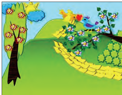
Рис. 5. Зустріч