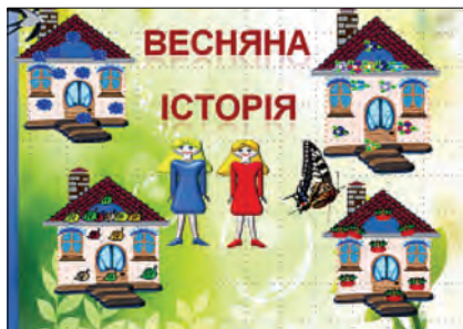
Рис. 9. Мультфільм «Весняна історія»